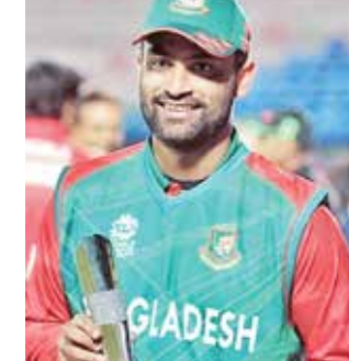
ફેબ્રુઆરી 2007માં ઝિમ્બાબ્વે સામેની ODI મેચથી તેની આંતરરાષ્ટ્રીય કારકિર્દીની શરૂઆત કરી હતી. તમીમ ઈકબાલે 70 ટેસ્ટ મેચમાં 38.89ની એવરેજથી 5134 રન બનાવ્યા છે. જેમાં 10 સદી અને 31 અડધી સદી સામેલ છે. તેના નામે 243 વનડેમાં 36.65ની

(એજન્સી) નવી દિલ્હી તા 12 બાંગ્લાદેશના પૂર્વ કેપ્ટન તમીમ ઈકબાલે ફરી આંતરરાષ્ટ્રીય ક્રિકેટમાંથી નિવૃત્તિ લઈ લીધી છે. આ બીજી વખત છે જ્યારે તેણે તેની કારકિર્દીને અલવિદા કહ્યું છે. તમીમ પણ જુલાઈ 2023માં આંતરરાષ્ટ્રીય ક્રિકેટમાંથી નિવૃત્તિ થઈ ગયો હતો, પરંતુ 24 કલાકની અંદર પોતાનો નિર્ણય બદલી નાખ્યો હતો. તમીમ તાજેતરમાં નેશનલ સિલેક્શન પેનલને મળ્યો હતો. ICC ચેમ્પિયન્સ ટ્રોફી માટે ટીમની જાહેરાત થાય તે પહેલા જ તેણે નિવૃત્તિ લઈ લીધી હતી. તમીમ સપ્ટેમ્બર 2023માં બાંગ્લાદેશ માટે છેલ્લી મેચ રમ્યો હતો. તેણે તેની આંતરરાષ્ટ્રીય કારકિર્દી ફેબ્રુઆરી 2007માં ઝિમ્બાબ્વે સામેની ODI મેચથી શરૂ કરી હતી. તમીમે