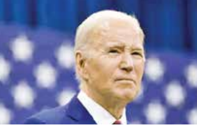
(એજન્સી) વોશિંગ્ટન તા 12

અમેરિકાનું કહેવું છે કે આ નવા પ્રતિબંધોને કારણે રશિયાને યુકેન સામે યુદ્ધ ચાલુ રાખવામાં આર્થિક મુશ્કેલીઓનો સામનો કરવો પડશે. ફાઈલ કોટો રશિયા સામે કાર્યવાહી કરતા અમેરિકા અને જાપાને અનેક નવા પ્રતિબંધોની જાહેરાત કરી હતી. રોઈટર્સ અનુસાર, અમેરિકાએ 200થી વધુ રશિયન કંપનીઓ અને 180થી વધુ જહાજો પર પ્રતિબંધ મૂક્યો છે. અમેરિકાએ બે ભારતીય કંપનીઓ સ્કાયહાર્ટ મેનેજમેન્ટ સર્વિસ અને એન્જિનિયર મેનેજમેન્ટ સર્વિસ પર પણ પ્રતિબંધ મૂક્યો છે. બાઈડન સરકારનું કહેવું છે કે આ ભારતીય કંપનીઓએ રશિયાથી LNG નું પરિવહન કર્યું હતું, જે અમેરિકા અને અમેરિકાને અને કંપનીઓની સંપત્તિઓ ફીજ કરી દીધી છે. આ સિવાય જાપાને પણ ઘણા એવા સંગઠનો સામે પ્રતિબંધોની જાહેરાત કરી છે જેણે અગાઉ લાદવામાં આવેલા પ્રતિબંધોથી બચવામાં રશિયાને મદદ કરી હતી.