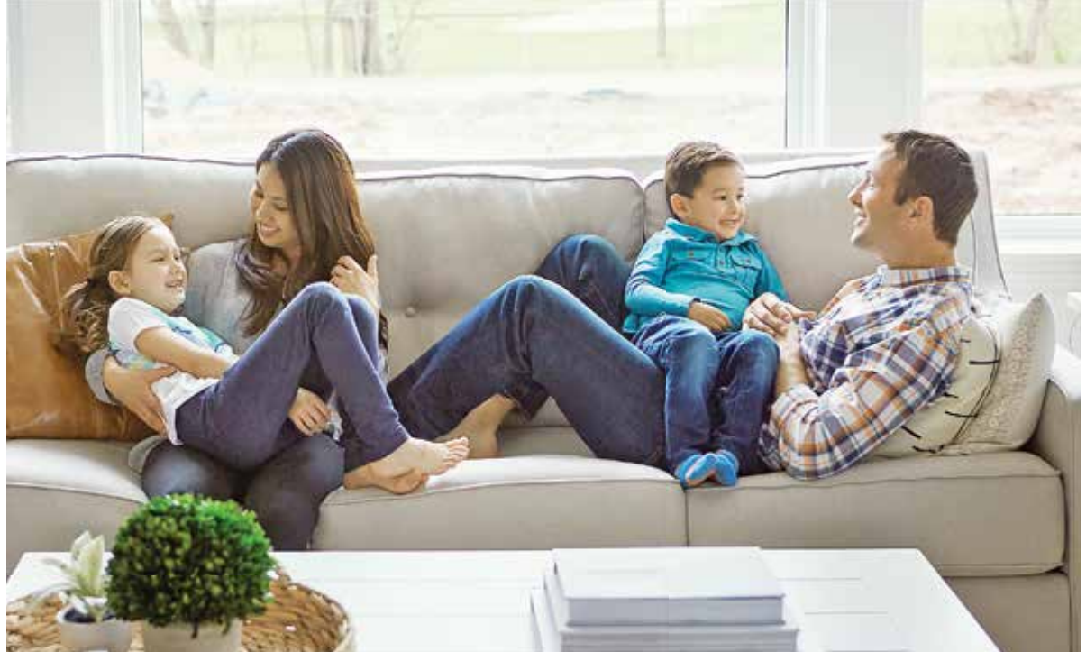
કુટુંબના સભ્યો જ્યારે સંયુક્ત પરિવારમાં નથી રહેતા અને પોતપોતાનું ઘર માંડીને પોતપોતાના સ્વતંત્ર વ્યવસાય-ધંધો શરૂ કરે છે ત્યારે પણ દરેક વિભક્ત પરિવાર વચ્ચે પ્રેમભર્યા આત્મીય વ્યવહાર શક્ય છે. વન્સ ઈન અ વ્હાઈલ મોટા ઘરે સો ભાઈઓ-ભાભીઓ-કઝીન્સ જમવા માટે ભેગા મળે ત્યારે આનંદમંગળનું વાતાવરણ રચાય છે, જાણે પ્રભુ હમણાં જ આ સુખી વિસ્તારને આશીર્વાદ આપવા ઊતરી આવશે. પણ સાવધાન, જુદા જુદા રહેતા ભાઈઓ ધંધામાં સાથે હશે તો વળી વિખવાદની શક્તિ ખરી. જેઠાણીની નાકની ચૂંક કરતાં દેરાણીની ચૂંક મોટી કેમ? બેઉ ભાઈઓ