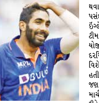
મેચમાં બોલિંગ કરી શક્યો ન હતો. ICC ચેમ્પિયન્સ ટ્રોફી 19 ફેબ્રુઆરીથી શરૂ થશે. ભારત તેની પ્રથમ મેચ 20 ફેબ્રુઆરીએ બાંગ્લાદેશ સામે રમશે. માર્ચના પ્રથમ સપ્તાહમાં જ સંપૂર્ણ ફિટ

(એજન્સી) નવી દિલ્હી તા 12 ભારતનો સ્ટાર ફાસ્ટ બોલર જસપ્રીત બુમરાહ આવતા મહિને યોજાનારી ICC ચેમ્પિયન્સ ટ્રોફીના ગ્રૂપ સ્ટેજમાંથી બહાર થઈ શકે છે. ઈન્ડિયન એક્સપ્રેસના રિપોર્ટ મુજબ, બુમરાહની પીઠમાં સોજો છે. આ માટે તેને બેંગલુરુમાં નેશનલ ક્રિકેટ એકેડમી (NCA)માં રિપોર્ટ કરવા માટે કહેવામાં આવ્યું છે. તેની રિકવરી પર અહીં નજર રાખવામાં આવશે. ઓસ્ટ્રેલિયા વિરૂદ્ધ સિડની ટેસ્ટના બીજા દિવસે બુમરાહને પીઠમાં થોડી તકલીફ થઈ હતી, ત્યારબાદ તેને સ્કેન માટે લઈ જવામાં આવ્યો હતો. આ પછી તે