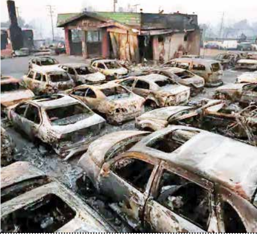
આગ પછી પાણીના ડાઈફેન્ટ્સ પાલી થયા : લોસ એન્જલસ વોટર ડિપાર્ટમેન્ટના જણાવ્યા અનુસાર, આગ લાગતા પહેલા કેલિફોર્નિયામાં તમામ વોટર ડાઈફેન્ટ્સ સંપૂર્ણ રીતે કાર્યરત હતા. આગ ઓલવવા માટે પાણીની વધુ માંગને કારણે સિસ્ટમ પર પ્રેશર વધ્યું અને જળસ્તરમાં ઘટાડો થયો. તેના કારણે 20% વોટર ડાઈફેન્ટ્સને અસર થઈ. ખરેખરમાં, કેલિફોર્નિયામાં ઘણી જગ્યાએ વોટર ડાઈફેન્ટ્સ પાલી થઈ ગયા છે. NYT મુજબ, રાજ્યના ગવર્નર ગેવિન ન્યૂઝોમે શુક્રવારે વોટર ડાઈફેન્ટ્સમાં આટલી ઝડપથી પાણી કેવી રીતે ખતમ થઈ ગયું.

અમેરિકાના કેલિફોર્નિયા રાજ્યમાં છેલ્લા 6 દિવસથી લાગેલી આગ પર હજુ સુધી કાબૂ મેળવી શકાયો નથી. જેના કારણે અત્યાર સુધીમાં 16 લોકોના મોત થયા છે. ઘણા લોકો ગુમ થવાની આશંકા છે. ભારે પવનને કારણે આગનો ફેલાવો વધ્યો છે. હાલમાં તે 80 કિમી પ્રતિ કલાકની ઝડપે ફેલાઈ રહ્યો છે. અમેરિકાને આગ પર કાબૂ મેળવવામાં મદદ કરવા માટે મેક્સિકોથી ફાયર ફાઈટર્સ પહોંચ્યા છે. આગના સંકટ વચ્ચે કેલિફોર્નિયાના સાંતા મોનિકા શહેરમાં લૂંટની ઘટના સામે આવી છે, જે બાદ વહીવટીતંત્રે કફરું જાહેર કર્યો છે. આ કેસમાં 20 લોકોની ધરપકડ કરવામાં આવી છે. રોઈટ્સના જણાવ્યા અનુસાર, લોસ એન્જલસ (LA)માં આગને કારણે અત્યાર સુધીમાં આશરે રૂ. 11.6 લાખ કરોડ (135 બિલિયન ડોલર)નું નુકસાન થવાનો અંદાજ છે. અહીં આગ પર અમુક અંશે કાબૂ મેળવી લેવામાં આવ્યો છે. અભિનેત્રીએ વધુમાં લખ્યું, 'મારી આસપાસના વિનાશથી હું ડુબી છું અને ભગવાનની આભારી છું કે અમે હજુ પણ સુરક્ષિત છીએ.' અભિનેત્રીએ આગળ વિસ્થાપિત થયેલા અથવા આગમાં બંધુ ગુમાવનારા લોકો માટે તેની સંવેદના વ્યક્ત કરતા પ્રાર્થના કરી. તેણે ફાયર વિભાગ, ફાયર ટીમના જવાનો અને જાન-માલને બચાવવામાં મદદ કરનાર દરેકનો આભાર માન્યો હતો. લોસ એન્જલસ કાઉન્ટી પોલીસ વિભાગે જણાવ્યું કે 16 મૃતકો સિવાય 13 લોકો હજુ પણ ગુમ છે. ડોગ સ્કોવોડની મદદથી આગ અસરગ્રસ્ત વિસ્તારોમાં આવેલા ઘરો અને અન્ય ઈમારતોમાં સર્ચ ઓપરેશન હાથ ધરવામાં આવી રહ્યું છે.