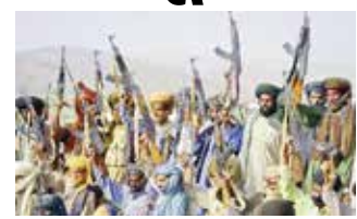
(એજન્સી) ઘરલામાબાદ તા 12

TTPએ ખૈબરમાં પરમાણુ પ્લાન્ટના કામદારોનું અપહરણ કર્યું હતું બીજા તરફ, ગુરુવારે અફઘાન તાલિબાન અને તહરીક-એ-તાલિબાન પાકિસ્તાન (TTP)એ ખૈબર પખતુનખવામાં મકીન અને માલિખેલાની સૈન્ય ચોકીઓ પર રોકેટ અને મોર્ટાર વડે હુમલો કર્યો હતો. આ પછી, ખૈબરમાં લક્કી મર્વતના એટોમિક એનર્જી પ્લાન્ટના 16 કામદારોનું અપહરણ કરવામાં હતું.