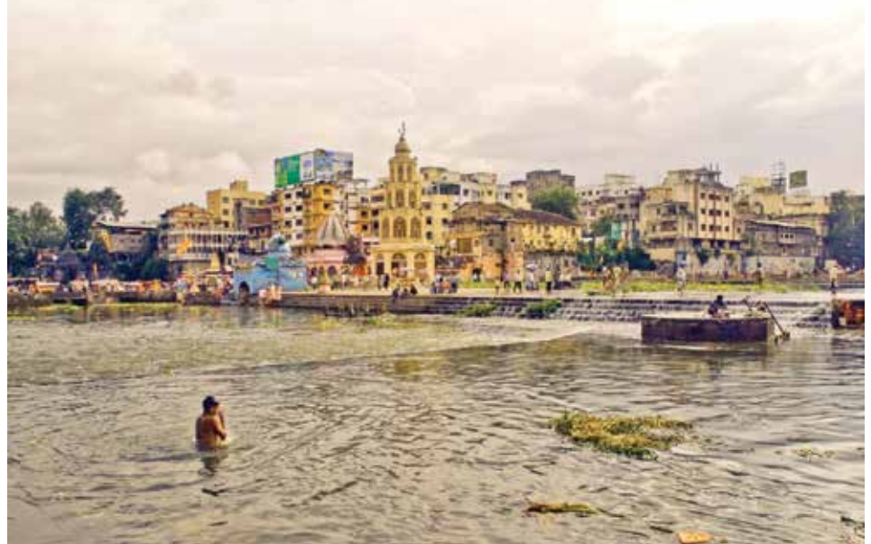
કરવો અશક્ય હતો. ભગવાન વિષ્ણુ ના પગ ની આંગળીઓ માંથી વહેતા ગંગાજી ને કેલાસ નિવાસી ભગવાન સદાશિવ એ એની જતા માં ધારણ કર્યાં છે. સ્વર્ગ માંથી ધસમસતા પ્રવાહમાં વહેતા ગંગાજી ને ભગવાન સદાશિવ એ ધારણ ના કર્યા હોત તો પૃથ્વી પર નું સંપૂર્ણ તણાઈ ચૂક્યું હોત. આમ નદી ને દેવી સ્વરૂપે સાંકળી ને એનું પૂજન અર્ચન થાય છે. માતા બાળક ને જન્મ આપીને ધાળે અને પોષે છે એજ રીતે નદી ના પાણી ના લીધે તૃપ્તિ થતાં મનુષ્ય નું જીવન ટકી શકે છે. ભોજન ગમે તેટલું સ્વાદિષ્ટ હોય પરંતુ પાણી વગર એને પાચન તંત્ર પચાવી શકતું નથી. વૈજ્ઞાનિકો એ અન્ય ગ્રહ મંગળ માં માનવ વસ્તી અસ્તિત્વ ના હતી એવો દાવો કર્યો હતો. આ દાવો કર્યો એની પાછળ નું તથ્ય શું? ત્યાં મંગળ ગ્રહ પર વૈજ્ઞાનિકો ને સુકાચિત નદીઓ,

ભગવાન વિષ્ણુ એ અત્યંત સુંદર સ્ત્રી મોહિની સ્વરૂપ ધારણ કર્યું. મોહિની સ્વરૂપ માં ભગવાન એ અમૃત કુંભ ને કમર પર મૂકી ને છમ છમ ઝાંઝર ના અવાજ માં દેવો અને દાનવો વચ્ચે પ્રગટ થયા. અતિ સુંદર સ્ત્રી ને નિહાળતા જ દાનવો ના મન કામુક બની ગયા. અતિ સુંદર સ્ત્રી ના દર્શન કરતાં જ દેવો ભગવાન વિષ્ણુ ના મોહિની સ્વરૂપ ને ઓળખી ગયા. અમૃત પી ને તૃપ્ત થયેલ દેવો ને જોતાજ રાહુ અને કેતુ યુધ્ધાપ દેવો ની સાથે બેસી ગયા ને અમરત્વ દેવો ની માફક પામી ગયા. જ્યારે દાનવો ને ભગવાન ની ચાલ સમજાય ત્યારે કુંભ માં માત્ર અમૃક ટીપાં અમૃત હતું. આ કુંભ દાનવો ના હાથે ના લાગે એટલે ગરુડ જ અમૃત કુંભ લઈને ઊભે આકાશ માં ઉડ્યા ત્યારે કુંભ માંનું અમૃત ચાર નદીઓ ગંગાજી, ગોદાવરી, કૃષ્ણા, પ્રયાગ રાજ ના ગંગા યમુના અને સરસ્વતી ના સંગમ તીર્થ માં ઢોળાયું હતું. આ કારણોસર જ્યાં આ નદીઓ વહે છે એ સ્થાન તીર્થો બન્યા છે દર ત્રણ વર્ષે આ તીર્થો માં કુંભ, અર્ધ કુંભ અને મહા કુંભ મેળોનું આયોજન થાય છે. ગોદાવરી નદી એ ગંગાજી નું જ સ્વરૂપ છે જે ભગવાન સદાશિવ ના જ્યોતિર્લિંગ ત્રંબકેશ્વર મહાદેવ ની ટેકરી પરથી વહી રહી છે. શિવ પુરાણ ની કોટી રુદ્રહિતા માં ૨૪ થી ૨૬ સહિતા માં ત્રંબકેશ્વર જ્યોતિર્લિંગ નું વર્ણન થયેલ છે. બ્રહ્મ ગિરી પર્વત પર ગૌતમ ઋષિ એના પત્ની અહલ્યા સાથે રહેતા હતા. ગૌતમ ઋષિ ની શિવ ભક્તિ અને તપશ્ચર્યા થી અન્ય ઋષિઓ ને ખૂબ ઈર્ષ્યા થતી હતી. આ કારણોસર ત્યાં વસતા અન્ય ઋષિઓ એ ગૌતમ ઋષિ પર ગો હતા નો આજ લગાડ્યો ને આ દ્વારા એમને અપમાનિત