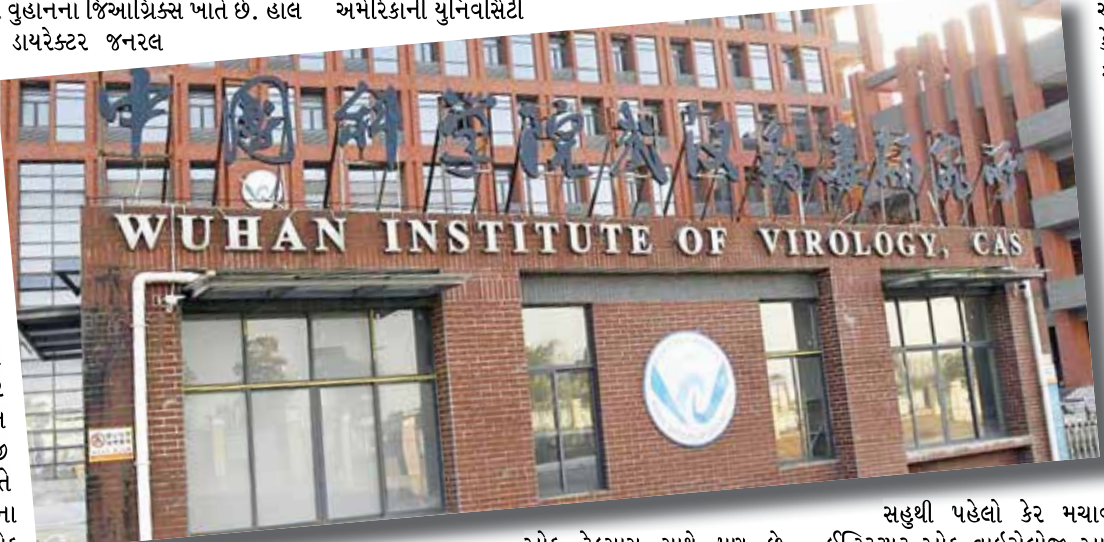
સહુથી પહેલો કેર મચાવ્યો તે વુહાનમાં જ ઈન્સ્ટિટ્યૂટ ઓફ વાઈરોલોજી આવેલી છે તે પણ એક હકીકત છે. હવે કોરોના વાઈરસ ચીનની ઈજ્જતી આખી દુનિયામાં પ્રસરી ગયો છે કે લેબોરેટરીની ભૂલથી એ કહેવું મુશ્કેલ છે. આ વાઈરસના કારણે ચીનમાં અંકલાપથી વધુ લોકો મોતને ભેટ્યા હતા. તેથી ચીનની લેબોરેટરીમાંથી અકસ્માતે તે બહાર છટક્યો હોય તે ચિયરી વધુ બંધ બેસે છે. જે હોય તે પણ કડવું સત્ય એ છે કે ચીનના વુહાનમાં ઈન્સ્ટિટ્યૂટ ઓફ વાઈરોલોજી છે તે ગુપ્ત રીતે તે કોરોના જેવાં જૈવિક શસ્ત્રો બનાવે છે. યાદ રહે કે બાયોલોજિકલ

પૃથક્કરણ, ઓળખ અને નામાબિકરણ કર્યું હતું. ચીનની આ ઈન્સ્ટિટ્યૂટ વિવિધ પ્રકારના વાઈરસની રસી નહીં, પણ ખતરનાક વાઈરસ પેદા કરી જૈવિક શસ્ત્રો બનાવતી હોવાની વાતો પણ ધૂમરાવા લાગી હતી. અલબત્ત, અમેરિકાનાં જ બીજાં અખબારોએ એ વાત તથ્યહીન હોવાનું કહ્યું હતું. આ પ્રકારનો વિરોધ જે નિષ્ણાતોએ કર્યો તે નિષ્ણાતોના અભિપ્રાય અમેરિકાના 'ધી વોશિંગ્ટન પોસ્ટ' નામના અખબારમાં પ્રગટ થયા હતા. જાન્યુઆરી 2020માં આ ઈન્સ્ટિટ્યૂટ પર કેટલાકે એવી શંકા સેવી હતી કે કોરોના વાઈરસ ચીને ઈરાદાપૂર્વક ફેલાવેલો નહીં, પરંતુ અકસ્માતે ચીનની જ વુહાન લેબોરેટરીમાંથી છટકેલો વાઈરસ છે. ચીનના સત્તાવાળાઓ આ વાત સ્વીકારતા નથી, પરંતુ ચીનના વુહાનમાં જ્યાંથી આ કોરોના વાઈરસે સહુથી પહેલો કેર મચાવ્યો તે વુહાનમાં જ ઈન્સ્ટિટ્યૂટ ઓફ વાઈરોલોજી આવેલી છે તે પણ એક હકીકત છે. હવે કોરોના વાઈરસ ચીનની ઈજ્જતી આખી દુનિયામાં પ્રસરી ગયો છે કે લેબોરેટરીની ભૂલથી એ કહેવું મુશ્કેલ છે. આ વાઈરસના કારણે ચીનમાં અંકલાપથી વધુ લોકો મોતને ભેટ્યા હતા. તેથી ચીનની લેબોરેટરીમાંથી અકસ્માતે તે બહાર છટક્યો હોય તે ચિયરી વધુ બંધ બેસે છે. જે હોય તે પણ કડવું સત્ય એ છે કે ચીનના વુહાનમાં ઈન્સ્ટિટ્યૂટ ઓફ વાઈરોલોજી છે તે ગુપ્ત રીતે તે કોરોના જેવાં જૈવિક શસ્ત્રો બનાવે છે. યાદ રહે કે બાયોલોજિકલ