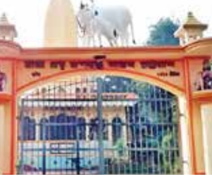
યટગાંવમાં મંદિરોની દાનપેટી લૂંટી લેવાઈ યટગાંવમાં હતહાજારી વિસ્તારમાં ચાર મંદિરોમાં લૂંટ ચલાવી હતી. મા વિષ્ણુચરી કાલી મંદિરમાં સોનાનાં આભૂષણો અને દાનપેટીની ચોરી કરવામાં આવી હતી. જ્યારે સત્યનારાયણ સેવા આશ્રમ, મા માગધેશ્વરી મંદિર અને જગબંધુ આશ્રમમાં પણ ચોરી થઈ હતી. આ ઉપરાંત કોક્સ બજારના શ્રીમંદિરમાં પણ ચોરી થઈ હતી. જ્યાં ચોરોએ સીસીટીવી રેકોર્ડિંગને નષ્ટ કરી દીધા છે.

ગત વર્ષે ઓગસ્ટમાં શેખ હસીનાની સરકાર ગબડી પડ્યા બાદ બાંગ્લાદેશની કમાન મોહમ્મદ યુનુસ સંભાળી રહ્યા છે. જોકે, મોહમ્મદ યુનુસ સત્તામાં આવ્યા બાદ હિન્દુઓ અને લઘુમતીઓ તેમજ મંદિર પર હુમલા અટકવાનું નામ લેતા નથી. તાજેતરમાં જ ઉગ્રવાદીઓએ 6 મંદિરોને નિશાન બનાવ્યાં. જેમાં યટગાંવમાં ચાર મંદિર પર હુમલો કરી લૂંટ ચલાવી હતી. લાલ મોનિરહાટમાં પણ મંદિરમાં લૂંટ થઈ હતી. બીજા તરફ બાંગ્લાદેશમાં હિન્દુઓ વિરુદ્ધ હિંસા અટકી રહી નથી. જેમાં બે હિન્દુઓની હત્યા અને એકનું અપહરણ કરાયું છે. ઉગ્રવાદીએ ઘરમાં ઘૂસીને કોલેજના પ્રોફેસર દિલીપકુમાર રોય(71)ની હત્યા કરી હતી. તેમજ જાલાપાદી જિલ્લામાં 26 વર્ષીય વેપારી સુવેદને ગળું કાપીને મોતને ઘાટ ઉતારી દેવાયો હતો.