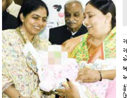
ગાંધીનગર સંવાદદાતા | વિજયવીર યાદવ

ગાંધીનગર સૌજન્ય એસ્ટ્રલ ફાઉન્ડેશન દ્વારા સંચાલિત સંસ્થા શિશુ ગૃહ સેક્ટર -15, ગાંધીનગર ખાતે એક અનોખો કાર્યક્રમ યોજાયો. જેમાં એક ત્યજ દેવાયેલી દિકરી અને એક દિકરાને દત્તક લેવાતા માતા પિતાની છત્રછાયા મળી છે. આ ક્ષણને વધુ યાદગાર બનાવવા માટે આ કાર્યક્રમ અંતર્ગત સામાજિક ન્યાય અને અધિકારીતા તથા મહિલા અને બાળ કલ્યાણ મંત્રી ભાનુબેન બાબરીયા ની વિશેષ ઉપસ્થિતિમાં વિધિવત રીતે કુમકુમ તિલક કરી બાળકની સોપણી દત્તક લેનાર માતા-પિતાને કરવામાં આવી. ઉલ્લેખનીય છે કે કાયદાકીય પ્રક્રિયા પૂર્ણ થયા પછી જ સત્તાવાર રીતે બાળક સોંપણીનો