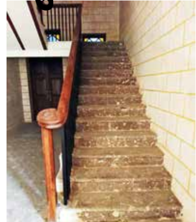
ઉપલેટા નગરપાલિકામાં આવેલા અને ગોંડલ સ્ટેટ વખતના હેરિટેજ ટાવર બિલ્ડિંગના રિનોવેશનના કામ કરવા માટે કરોડો રૂપિયાની રકમ મંજૂર થઈ હોવાની માહિતી સામે આવી છે જેમાં આ કરોડોની મંજૂર થયેલી રકમમાં પણ ભ્રષ્ટાચારને કારણે આ મંજૂર થયેલી કરોડોની રકમ હવે ટૂંકી પડી ગઈ છે કારણ કે આ સમારકામ માટે ઉપલેટા નગરપાલિકા કચેરી દ્વારા ખર્ચમાં વધારો કરવા માટેની પણ ઉચ્ચ કક્ષાએ માંગણી કરી લીધી છે અને ખર્ચમાં વધારો પણ મંજૂર થઈ ચૂક્યો છે ત્યારે કરોડોના ખર્ચે મંજૂર થયેલા કામમાં કરોડો રૂપિયા વાપર્યા બાદ પણ પરિણામ

ઉપલેટા શહેરની અંદર આવેલ અને ગોંડલ સ્ટેટના મહારાજા ભગવતસિંહજી બાપુના ઉપલેટાને મળેલા અમૂલ્ય અને કીમતી એવા હેરિટેજ તાલુકા ટાવર બિલ્ડિંગ અને ફિક્સેટ ગ્રાઉન્ડના નવીનીકરણ માટે સરકાર દ્વારા કરોડો રૂપિયાની ગ્રાન્ટ ફાળવવામાં આવી છે જેમનું કામ બે વર્ષથી ચાલી રહ્યું હતું પરંતુ છેલ્લા છ એક મહિનાથી આ કામ સંપૂર્ણ પૂર્ણ થઈ ગયો હોય અને કોન્ટ્રાક્ટરો અને મજૂરો અહીંથી ચાલ્યા ગયા હોવાનું સામે આવ્યું હતું જેમાં ઉપલેટાના એક જાગૃત નાગરિકે આ મામલે માહિતી માંગતા અરજદારને કોઈપણ પ્રકારની માહિતી આજદિન સુધી પૂરી તો પાડવામાં આવી નથી જેથી આ માહિતીઓ પૂરી ન પાડનાર અને બેજવાબદારી ભર્યા કામો અને ભરપૂર ભ્રષ્ટાચાર હોવાની બાબતને લઈને રાજકોટ જિલ્લા કલેક્ટર, ગુજરાત શહેરી વિકાસ વિભાગના અગ્ર સચિવ અને ગુજરાત રાજ્યના મુખ્યમંત્રીના કાર્યાલય સુધી લેખિત ફરિયાદ કરવામાં આવતા તંત્ર હવે આ મામલે ઢાંકપીછોડા કરવા માટે રંગરોગાન શરૂ કરી ભ્રષ્ટાચાર ના ઉખડી ગયેલા પોપડાને ઢાંકવા માટેની અને ઉચ્ચકક્ષાએ તપાસ આવે તો સુશોભિત અને સુંદર કામગીરી થયેલ હોવાનું દેખાય તે માટેની તાબડતો કામગીરી હાથ ધરી રહી છે.