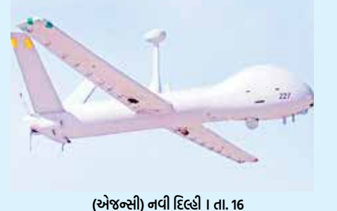
(એજન્સી) નવી દિલ્હી | તા. 16