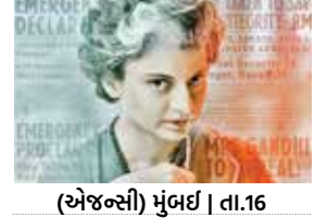
(અજન્સી) મુંબઈ | તા.16

કંગના રણોત્તની 'ઈમરજન્સી' ફિલ્મ બાંગ્લાદેશમાં રિલીઝ કરાશે નહીં. બંને દેશો વચ્ચેનાં સંબંધો હાલ વણસ્યા હોવાથી આ નિર્ણય લેવાયો છે. સ્વ. વડાપ્રધાન ઈંદિરા ગાંધીએ પાકિસ્તાનથી બાંગ્લાદેશની આઝાદીમાં મહત્વની ભૂમિકા ભજવી હતી. ફિલ્મમાં ૧૯૭૧ના બાંગ્લાદેશ સ્વતંત્રતા સંગ્રામમાં ભારતીય સેના અને ઈંદિરા ગાંધીની સરકારની ભૂમિકા તેમજ શેષ મુજબુર રહેમાનન ભારતનાં સમર્થનને દર્શાવવામાં આવ્યું છે. ફિલ્મમાં બાંગ્લાદેશી ચમરખંથીઓના હાથે શેષ મુજબુર રહેમાનની હત્યાને પણ દર્શાવવામાં આવી છે. બાંગ્લાદેશમાં હાલના સત્તા પટ્ટા પછી બાંગ્લાદેશના યુદ્ધને અલગ સંદર્ભમાં જોવામાં આવી રહ્યું છે. આથી આ ફિલ્મ પર પ્રતિબંધ લદાયો છે.