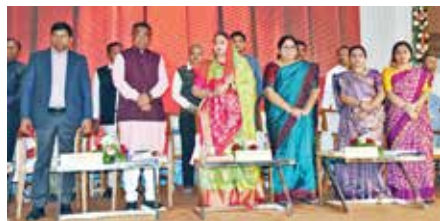
ગાંધીનગર સંવાદદાતા | વિજયવીર યાદવ

સંવિધાનનો અમૃત મહોત્સવ- બંધારણના 75 માં વર્ષની ઉજવણી અંતર્ગત ગુજરાત સરકારના સામાજિક ન્યાય અને અધિકારીતા વિભાગ હસ્તકના અનુસૂચિત જાતિ કલ્યાણ વિભાગ દ્વારા સામાજિક ક્ષેત્રે અપાતા ડો.બાબા સાહેબ આંબેડકર એવોર્ડ, મહાત્મા ગાંધી એવોર્ડ, સંત કબીર સાહિત્ય એવોર્ડ, સાવિત્રીબાઈ ફૂલે મહિલા કલા સાહિત્ય એવોર્ડ, મહાત્મા ફૂલે શ્રેષ્ઠ પત્રકાર એવોર્ડ અને દાસી જીવણ શ્રેષ્ઠ સાહિત્ય કૃતિ એવોર્ડ અર્પણ વિધિ સમારોહ સામાજિક ન્યાય અને