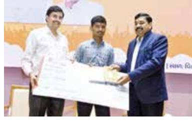
(એજન્સી) ગાંધીનગર | તા.16

'નેશનલ સ્ટાર્ટઅપ ડે - 202૫'નો દિવસ નવીન વિચારો, આઈડિયા અને સંકલ્પો સાથે દેશને ગ્લોબલ ઇનોવેશન હબ બનાવવા માટેની પ્રતિબદ્ધતાનું પ્રતિક છે. રાજ્યમાં શરૂ કરવામાં આવેલ SSIP ૧.૦માં માત્ર સાયન્સ અને ટેકનોલોજીના વિદ્યાર્થીઓ જ ભાગ લઈ શકતા હતા. પરંતુ આજે મુખ્યમંત્રી શ્રી ભૂપેન્દ્ર પટેલના નેતૃત્વમાં સ્ટુડન્ટ સ્ટાર્ટઅપ ઇનોવેશન પોલિસીને વેગ આપતી SSIP ૨.૦ અંતર્ગત પ્રાથમિક, માધ્યમિક અને ઉચ્ચતર માધ્યમિકના વિદ્યાર્થીઓ તથા સાયન્સ, કોમર્સ અને આર્ટ્સ એમ દરેક