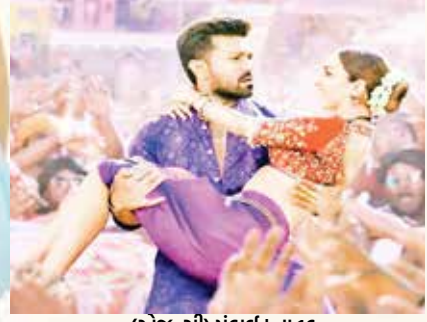
(અજન્સી) મુંબઈ | તા.16

કિયારા અડવાણીની હાલની રિલીઝ થયેલી ફિલ્મ 'ગોમચેન્જર' બ્લોકબસ્ટર થાય તેવી અપેક્ષા હતી. પરંતુ આ ફિલ્મ ફ્લોપ થઈ જતાં કિયારાની કારકિર્દી પર સંકટનાં વાદળો છવાયાં છે. કિયારા અડવાણી સાથે આવું પ્રથમ વખત થયું નથી. આ પહેલા ૨૦૨૩ની 'સલ્વપ્રેમ કી કથા' મહા મુશ્કેલીએ ૭૭.૫૫ કરોડ રૂપિયાનું લાઈફટાઈમ કલેક્શન કરી શકી હતી. જોકે આ ફિલ્મ ફ્લોપ નહોતી કહેવાઈ પરંતુ કિયારાની પાછળની ફિલ્મોની સફળતાની સરખામણીમાં આ ફિલ્મનું બોક્સ ઓફિસ કલેક્શન ઘણું ઓછું હતું. એટલું જ નહીં કિયારાની ૨૦૨૨માં રિલીઝ થયેલી ફિલ્મ 'જુગજુગ જીયા' એ ૮૫.૦૩ કરોડ રૂપિયાનું લાઈફટાઈમ કલેક્શન કર્યું હતું. આ ફિલ્મે પણ અપેક્ષા કરતાં બોક્સ ઓફિસ પર ભુલુ ઓછી કમાણી કરી હતી. કિયારાની છેલ્લી સફળ ફિલ્મ ૩૦ મહિના પહેલા રિલીઝ થઈ હતી. ૨૦૨૨માં 'ભૂલ ભૂલેયા ટૂ' એ ૧૮૫.૮૨ કરોડ રૂપિયાની કમાણી કરી હતી. જે બ્લોકબસ્ટર ફિલ્મ કહી શકાય. તે પછી કિયારાની એક પણ ફિલ્મ બોક્સ ઓફિસ પર સારો વ્યવસાય કરી શકી નથી. હવે કિયારાની કારકિર્દીનો આધાર ૨૦૨૫ની 'ટોક્સિક' અને 'વોર' ફિલ્મની સીકવલ છે.