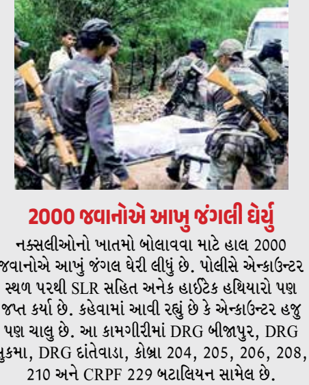
2000 જવાનોએ આખું જંગલી ઘેરું નકસલીઓનો ખાતમો બોલાવવા માટે હાલ 2000 જવાનોએ આખું જંગલ ઘેરી લીધું છે. પોલીસે એન્કાઉન્ટર સ્થળ પરથી SLR સહિત અનેક હાથેક હથિયારો પણ જપ્ત કર્યા છે. કહેવામાં આવી રહ્યું છે કે એન્કાઉન્ટર હજુ પણ ચાલુ છે. આ કામગીરીમાં DRG બીજાપુર, DRG સુકમા, DRG દાંતેવાડા, કોશા 204, 205, 206, 208, 210 અને CRPF 229 બટાલિયન સામેલ છે.

(એજન્સી) બીજાપુર | તા.16 છત્તીસગઢના બીજાપુરના જંગલોમાં ગુરુવારે સવારથી સુરક્ષા દળો અને નકસલીઓ વચ્ચે એન્કાઉન્ટર ચાલી રહ્યું છે. સાંજ સુધીમાં, સુરક્ષા દળોએ આ એન્કાઉન્ટરમાં 12 નકસલીઓને ઠાર કર્યા છે. સ્થાનિક પોલીસે આ માહિતી આપી છે. બીજાપુર અને તેલંગાણાની સરહદે આવેલા 3 જિલ્લાઓમાં સુરક્ષા દળો દ્વારા એક મોટું ઓપરેશન હાથ ધરવામાં આવી રહ્યું છે. સવારથી જ નકસલવાદીઓ અને સુરક્ષા દળો વચ્ચે સમયાંતરે ગોળીબાર થઈ રહ્યો છે. બીજાપુરમાં નકસલવાદીઓ વિરુદ્ધ સુરક્ષા દળોએ મોટું ઓપરેશન શરૂ કર્યું છે. તેલંગાણાની સરહદ પર આવેલા ઘણા ગામોમાં નકસલવાદીઓ સામે કાર્યવાહી કરવામાં આવી રહી છે. પોલીસે આ માહિતી આપી છે.