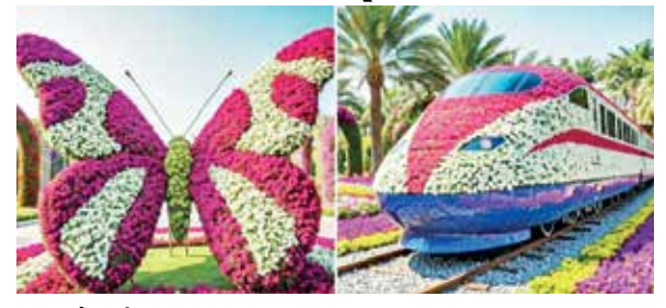
ફ્લાવર શો જોવા પહોંચ્યા હતા. 3 જાન્યુઆરીથી અત્યાર સુધીમાં કુલ 6.23 લાખ લોકો ફ્લાવર શોની મુલાકાત લઈ ચૂક્યા છે. જેમાં 1.87 લાખ બાળકોનો સમાવેશ થાય છે. જ્યારે 5.93 શોમાં પહેલીવાર આટલી મોટી કરોડની આવક થઈ છે. લોકોના ધસારાને પગલે ફ્લાવર શો વધુ બે દિવસ લંબાવવામાં આવ્યો છે.

ઉત્તરાયણના એક જ દિવસમાં રેકોર્ડબ્રેક 1.32 લાખે લોકોએ ફ્લાવર શો જોયો ઉત્તરાયણની રજાના દિવસે રેકોર્ડબ્રેક 1.32 લાખ લોકોએ ફ્લાવર શો જોયો હતો. જેથી સ્યુનિ.ને 86 લાખની આવક થઈ છે. 2013થી યોજાતા ફ્લાવર સ્ટેશનના P1ને સસ્પેન્ડ કર્યાં હતા. ત્યારે હવે નીતિનની સંખ્યામાં મુલાકાતીઓ આવ્યા હતા. વાસી ઉત્તરાયણના દિવસે પણ 72 હજારથી વધુ લોકો ફ્લાવર શો જોવા પહોંચ્યા હતા. 3 જાન્યુઆરીથી અત્યાર સુધીમાં કુલ 6.23 લાખ લોકો ફ્લાવર શોની મુલાકાત લઈ ચૂક્યા છે. જેમાં 1.87 લાખ બાળકોનો સમાવેશ થાય છે. જ્યારે 5.93 શોમાં પહેલીવાર આટલી મોટી કરોડની આવક થઈ છે. લોકોના ધસારાને પગલે ફ્લાવર શો વધુ બે દિવસ લંબાવવામાં આવ્યો છે.