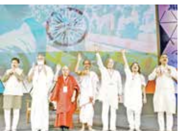
(એજન્સી) નવી દિલ્હી | તા. 16

ઈન્ટરનેશનલ ટેમ્પલ્સ કન્વેન્શન એન્ડ એક્સ્પો (આઈટીસીએક્સ) તેની બીજી જ અપેક્ષિત બીજી આવૃત્તિ સાથે ભવ્ય વાપસી કરી રહ્યું છે. ૨૦૨૩ માં તેના ઉદ્ઘાટન પ્રકરણની અસાધારણ સફળતાના આધારે, જેણે વ્યાપક પ્રશંસા મેળવી હતી, આ સંમેલનને વડા પ્રધાન નરેન્દ્ર મોદી અને કેન્દ્રીય ગૃહમંત્રી અમિત શાહનો પણ ટેકો મળ્યો. આ વર્ષે, આ સંમેલન