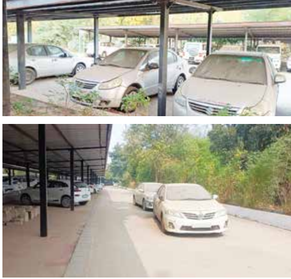
(એજન્સી) ગાંધીનગર તા. 16

ગાંધીનગર નવા સચિવાલય ખાતે આવેલા પાર્કિંગમાં સરકારી વાહનો પાર્ક કરી દેવામાં આવ્યા છે. આ એવા વાહનો છે જે ઘણાં સમયથી ઉપયોગમાં લેવામાં ન આવતાં તેનો નિકાલ કર્યા વિના પાર્ક કરી દેવાયા છે. આ તમામ વાહન હાલ સચિવાલયમાં પૂળ પાઈ રહ્યા છે. ગાંધીનગર સચિવાલયમાં 4 મુખ્ય પાર્કિંગ આવેલા છે. આ પાર્કિંગમાંથી એક પાર્કિંગ ખાસ ધારાસભ્યો માટે છે અને અન્ય પાર્કિંગમાં સચિવાલય સ્ટાફ, અધિકારીઓ, મંત્રીઓ તેમજ મુલાકાતીઓ પોતાના વાહનો પાર્ક કરે છે. આ વાહન પાર્કિંગમાં જે સરકારી વાહનો હવે