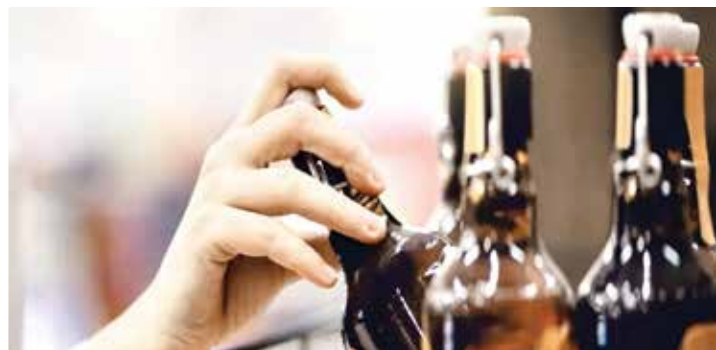
(એજન્સી) વડોદરા | તા.16

વડોદરા શહેરના રાજમહેલ રોડ પર આવેલા મરી માતાના ખાયામાં એક્ટિવિટીની ડેકીમાં દારૂ લાવીને વેચાણ કરતા શખ્સને એલસીબી ઝોન-2ની ટીમે ઝડપી પાડ્યો હતો. તેની પાસેથી વિદેશી દારૂના ક્વાટર, મોબાઈલ, એક્ટિવિટી અને રોકડ રકમ મળી