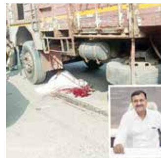
થોડા દિવસમાં જ ટ્રકની લગ્ન હતા ઘરે ખુશીનો માહોલ માતમમાં ફેલાયો

મહેશ એલ.સોની | નખત્રાણા નખત્રાણા તાલુકાના મુખ્ય મથક એવા નખત્રાણામાં ટ્રાફિક સમસ્યા દિવસે ને દિવસે વકરી રહી છે. વળી ભુજ લખપત ઢાઈવે પણ નગરની અંદરથી પસાર અને પાનપુર તાલુકાની અવરજવરથી સતત ધમધમતો હોય છે. સતત વાહન અવર જવરના કારણે ઠેક ઠેકાણે મોટા પાડાઓ પડી ગયા છે અને એ કારણે અવાર નવાર નાના મોટા અકસ્માતો સર્જાતા હોય છે. બાયપાસ રોડની વર્ષો જુની લગ્ન હોવાથી મહેમાનોને લેવા ગયેલ ત્યારે ઘરે પાછા ફરતી વખતે તેમને કાળ આંભી ગયો હતો. તેઓ છેલ્લા ૩૫ વર્ષથી જૈન સંઘના ટ્રસ્ટી તરીકે નવાવાસ તેમજ જુનાવાસમાં ચિંતામણી ટ્રસ્ટ સર્જાતા હોય છે. બાયપાસ રોડની વર્ષો જુની લગ્ન હોવાથી મહેમાનોને લેવા ગયેલ ત્યારે ઘરે પાછા ફરતી વખતે તેમને કાળ આંભી ગયો હતો. તેઓ છેલ્લા ૩૫ વર્ષથી જૈન સંઘના ટ્રસ્ટી તરીકે નવાવાસ તેમજ જુનાવાસમાં ચિંતામણી ટ્રસ્ટ