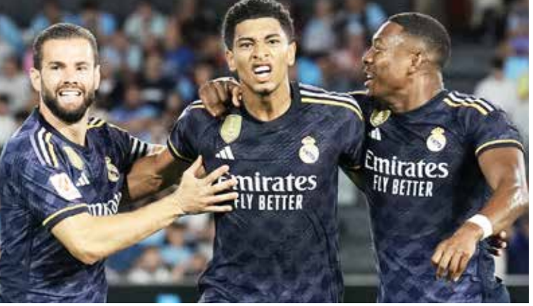
(અંજન્સી) લંડન તા 18

ટાઇટલ માટેની ફેવરિટ ટીમોમાં સામેલ રિયલ મેડ્રિડે સેલ્ટા વિગોને એક્સ્ટ્રા ટાઇમમાં ત્રણ ગોલ કરીને હોમ ગ્રાઉન્ડ ઉપર 5-2થી હરાવીને કોપા ડેલ રે કપ ફૂટબોલની ક્વાર્ટર ફાઇનલમાં પ્રવેશ કર્યો હતો. કિલિયન મબાપેએ 37મી મિનિટે ગોલ કરીને ટીમ માટે ખાતું ખોલ્યું હતું. જોકે તેના આ ગોલ વખતે વિવાદ સર્જાયો હતો. રેકર્ડીએ વીએઆર સિસ્ટમનો ઉપયોગ કરવાનો ઈનકાર કરી દીધો હતો. પ્રથમ હાફ પૂરો થાય તે પહેલાં 48મી મિનિટે વિનિસિયસ જુનિયરે ગોલ