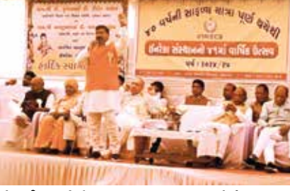
લોકાર્પણ ઈનરેકા સંસ્થાના બાળકોએ વિવિધ સાંસ્કૃતિક કાર્યક્રમો પ્રસ્તુત કર્યા, વર્ષ દરમિયાન વિવિધ ક્ષેત્રમાં ઉત્કૃષ્ટ દેખાવ કરનાર વિદ્યાર્થીઓને મહાનુભાવોના હસ્તે સન્માનિત કરાયા હતા. આદિજાતી મંત્રી કુબેર ડિંડોરે ધારાસભ્ય ચૈતર વસાવા નાં ગદ્ય માં આવી ને તેમનું નામ લીધા વગર

નર્મદા જિલ્લાના દેડીયાપાડા ની ઈનરેકા સંસ્થા માં 41માં વાર્ષિક મહોત્સવમાં હાજરી આપવા પહોંચેલા રાજ્યના આદિજાતી અને શિક્ષણ મંત્રી કુબેર ડિંડોર નું શાળા દ્વારા ભવ્ય સ્વાગત કરવામાં આવ્યું હતું. તેમની સાથે સાંસદ મનસુખ વસાવા, અર્જુનભાઈ ચૌધરી, મોતિસિંહ વસાવા, શંકરભાઈ વસાવા સહિત ઈનરેકા સંસ્થાના સ્થાપક વિનોદ કૌશિક અને તેમની ટીમ દ્વારા વિવિધ સાંસ્કૃતિક કાર્યક્રમ રાખવામાં આવ્યો હતો. ગુજરાત સરકારના આદિજાતી વિકાસ અને શિક્ષણ વિભાગના મંત્રી ડૉ.કુબેરભાઈ ડિંડોરની ઉપસ્થિતિમાં ઈનરેકા સંસ્થાના દિંબાપાડાનો 41મો વાર્ષિકોત્સવ યોજાયો ઈનરેકા સંસ્થાના દ્વારા સંચાલિત વંદના નર્સિંગ એન્ડ પેરા મેડીકલ કોલેજનું મંત્રી તથા ભરૂચના સાંસદ તેમજ ઉપસ્થિત મહાનુભાવોના હસ્તે