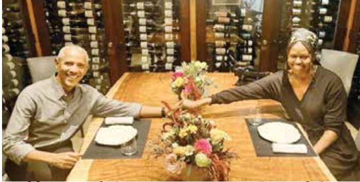
મીડિયામાં ચાલી રહેલા સમાચાર બાદ બરાક ઓબામાની પોસ્ટ

અમેરિકાના પૂર્વ રાષ્ટ્રપતિ બરાક ઓબામા અને તેમની પત્ની મિશેલ ઓબામાને દુનિયાનું સૌથી પ્રિય કપલ માનવામાં આવે છે. તે જોડી જેને જોઈને દરેક લોકો કહી ઉઠે છે વાહ ક્યા બાત હે, પરંતુ હાલ કેટલાક સમયથી આ કપલને લઈને એક સમાચાર સોશિયલ મીડિયા પર વાયરલ થઈ રહ્યા છે. સમાચાર એ છે કે બરાક ઓબામા અને મિશેલ ઓબામા વચ્ચે બધું બરાબર નથી. બરાક અને મિશેલની સ્થિતિ છૂટાછેડા સુધી પહોંચી ગઈ છે. પરંતુ બરાક ઓબામાએ આ બધી અફવાઓ પર પૂર્ણવિરામ મુકી દીધું છે. ઓબામાએ પોતાની પોસ્ટમાં લખ્યું કે મારા જીવનના પ્રેમને તેમના જન્મદિવસ પર ખૂબ ખૂબ અભિનંદન, આ સાથે તેમણે એક ફોટો પણ શેર કર્યો જેમાં કપલ ડિનર કરતા જોવા મળે છે. તેણે આગળ લખ્યું કે તમે મારા જીવનનો દરેક પાલી ઓરડો ભરી દીધો, જેમાં બધું જ છે. તમે હંમેશા તે કરવામાં ખૂબ જ સારા લાગે છે, હું ખૂબ નસીબદાર છું કે હું તમારી સાથે જીવનમાં બધું જ કરી શકું છું.