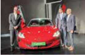
(એજન્સી) નવી દિલ્હી | તા.18

જેએસબ્લ્યુ એમજી મોટરે ઈન્ડિયાએ બે નવા મોડેલ લોન્ચ કરીને 'એક્સિલિબલ લક્ઝરી'ના નવા યુગમાં પ્રવેશ કર્યો છે. આ નવા મોડેલો છે - ભારતની પ્રથમ ઓલ-ઇલેક્ટ્રિક રોડસ્ટર એમજી સાયબરસ્ટર અને એમ9 માટે પ્રી-રિઝર્વેશન આજથી શરૂ થાય છે અને ગ્રાહકો www.mgselect.co.in પર લોગ ઇન કરીને આ બંને કારને પ્રી-બુક કરી શકે છે. આ બે નવા મોડેલો સાથે, બ્રાન્ડ પાસે ટૂંક સમયમાં પાંચ અલગ અલગ સેગમેન્ટ મોડેલો સાથે સૌથી મોટો ઇલેક્ટ્રિક વાહન પોર્ટફોલિયો હશે, જેમાં એમજી વિન્ડસરનો સમાવેશ થાય છે જે લોન્ચ થયા પછીથી સૌથી વધુ વેચાતી ઇલેક્ટ્રિક કાર રહી છે. આ ઉપરાંત તેમાં સામેલ હશે - એમજી ક્રોમેટ અને એમજી ઝેએસ.