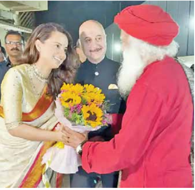
(એજન્સી) મુંબઈ | તા.18

'ઇમરજન્સી'ની સફળતા માટે આશીર્વાદ લીધા, કહ્યું- અમે ભાગ્યશાળી છીએ કે ગુરુજી અમારી ફિલ્મના સ્ક્રીનિંગમાં આવ્યા