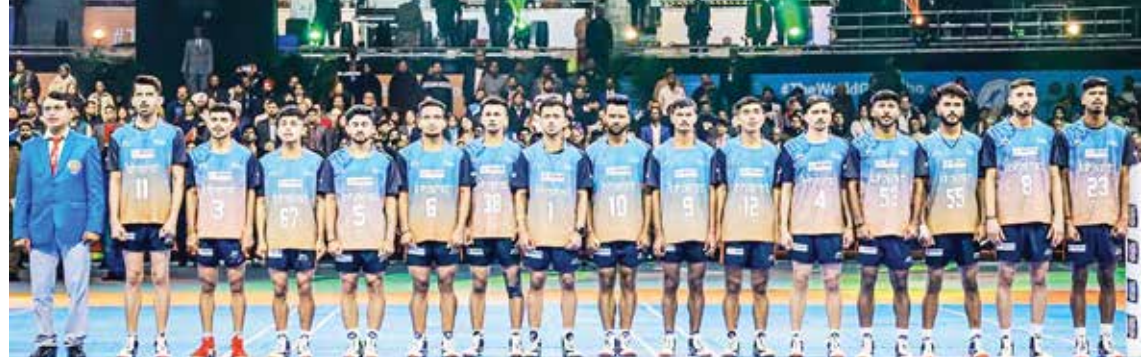
(અંજન્સી) નવી દિલ્હી તા 18

નવી દિલ્હીમાં રમાઈ રહેલા સૌ પ્રથમ ખો-ખો વર્લ્ડ કપમાં ભારતની પુરૂષ અને મહિલા બંને ટીમોએ જોરદાર પ્રદર્શન કર્યું છે. મહિલા ટીમે ક્વાર્ટર ફાઇનલમાં બાંગ્લાદેશને 93 પોઇન્ટના મોટા અંતરથી હરાવી સેમીફાઇનલમાં પ્રવેશ કર્યો છે. ભારતે 109-16ના સ્કોર સાથે જીત મેળવી હતી. ખો ખો વર્લ્ડ કપ 2025માં ભારતનું શાનદાર પ્રદર્શન ચાલુ છે અને ભારતીય ટીમે મહિલા વર્ગમાં શાનદાર જીત