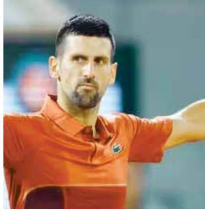
(અંજન્સી) નવી દિલ્હી તા 18

અલ્કારાઝ અને જોકોવિચનો વિજય સાતમા ક્રમાંકિત નોવાક જોકોવિચ તથા ત્રીજા ક્રમાંકિત કાર્લોસ અલ્કારાઝે પોતપોતાના મુકાબલા જીતીને ઓસ્ટ્રેલિયન ઓપન ગ્રાન્ડસ્લેમ ટેનિસ ટુર્નામેન્ટની મેન્સ સિંગલ્સના અંતિમ-16માં પ્રવેશ કરી લીધો હતો. કારકિર્દીમાં 17મી વખત મેલબોર્ન પાર્ક ખાતેના ગ્રાન્ડસ્લેમના અંતિમ-16માં પ્રવેશ કરનાર જોકોવિચે બે કલાક 22 મિનિટ સુધી રમાયેલી મેચમાં મયાઓને 6-1, 6-4, 6-4થી હરાવ્યો હતો.