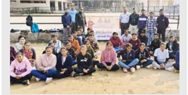
સ્વામી વિવેકાનંદ ગુજરાત રાજ્ય યુવા બોર્ડ અરવલ્લી જિલ્લા દ્વારા સ્વામી વિવેકાનંદ રમતોત્સવ 2025 અંતર્ગત શ્રી મ.લા ગાંધી કોલેજ કેમ્પસ મોડાસા ખાતે કાર્યક્રમનું આયોજન કરવામાં આવ્યું. જેમાં જિલ્લા રમત-ગમત અધિકારીશ્રી, કોલેજના પી.ટી.આઈ શિક્ષકોશ્રી તથા યુવા બોર્ડના સંયોજકો હાજર રહ્યા અને મોટી સંખ્યામાં કોલેજ ના વિદ્યાર્થીઓ પારંપારિક રમતોમાં સહભાગી થયા.

સરકારી કર્મચારીઓના પગાર, ભથ્થાં અને પેન્શન પર ખર્ચનો ભોજ પહેલેથી જ એટલો વધારો છે કે સરકાર માટે ખાલી જગ્યાઓ ભરવાનો પડકાર છે. સરકારી સેવાઓ આકર્ષક રહે તે ખૂબ જ મહત્વપૂર્ણ છે, પરંતુ એવી પરિસ્થિતિ પણ યોગ્ય નથી કે શિક્ષિત અને લાયક યુવાનો ઘરે બેસીને સરકારી નોકરીની રાહ જોઈને પોતાના કિંમતી વર્ષો બગાડવાનું સમજદારીભર્યું માનવા લાગે. એક તરફ બેરોજગારી વૃદ્ધિ અને બીજી તરફ સરકારી ભરતી પર અધોષિત પ્રતિબંધ પરિસ્થિતિને વધુ ખરાબ કરી શકે છે. સંતુલિત દૃષ્ટિકોણ: આવી પરિસ્થિતિમાં, નિર્ણય લેતી વખતે ઉતાવળ ન કરવી તે ખાસ કરીને મહત્વપૂર્ણ બની જાય છે. બધા પાસાઓનો કાળજીપૂર્વક વિચાર કરીને સંતુલિત અભિગમ અપનાવીને આગળ વધવાની જરૂર છે.