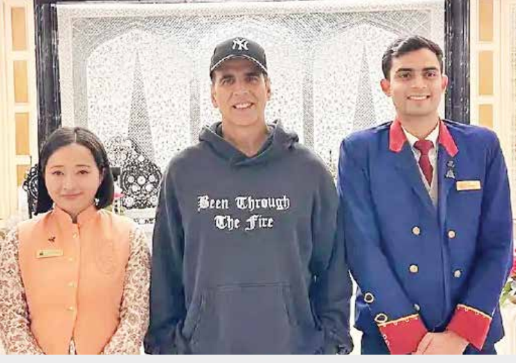
(એજન્સી) મુંબઈ | તા.18