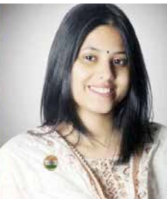
(અંજન્સી) નવી દિલ્હી તા 18

ટીમ ઈન્ડિયાના બેટ્સમેન રિંકુ સિંહે સગાઈ કરી લીધી હોવાના સમાચાર સોશિયલ મીડિયા પર વાયરલ થયા છે. સોશિયલ મીડિયા પર દાવો કરવામાં આવી રહ્યો છે કે રિંકુ સિંહે સમાજવાદી પાર્ટીના સાંસદ સાથે સગાઈ કરી લીધી છે. ટૂંક સમયમાં રિંકુ સિંહ લગ્ન કરવા જઈ રહ્યો છે એવા પણ સમાચાર સામે આવ્યા છે. ટીમ ઈન્ડિયાના બેટ્સમેન રિંકુ સિંહે યુપી સાંસદ પ્રિયા સરોજ સાથે સગાઈ કરી લીધી હોવાના સમાચાર સોશિયલ મીડિયા પર ખૂબ વાયરલ થઈ રહ્યા છે.