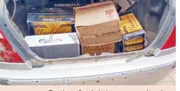
ભૂતકાળમાં ચિતરોલથી કરોડોનો દારૂ પકડાયો હતો

રાજપીપળા પોલીસે સ્ટેશન નજીક ના વિસ્તાર માંથી ગાંધીનગર સ્ટેટ મોનીટરીંગ ટીમે અંગ્રેજી દારૂ નો મોટો જથ્થો પકડી પાડતાં રાજપીપળા પોલીસ અજાણ હતી કે કોઈની રહેમ નજર હેઠળ આ વેપલો ચાલતો હતો તેવા સવાલ હાલ ચર્ચામાં છે.