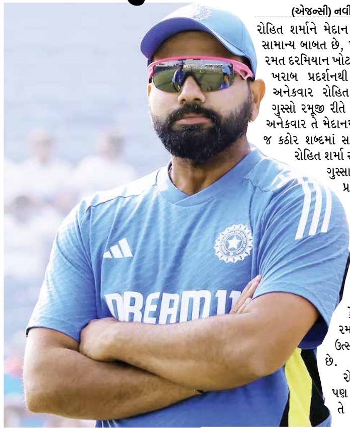
(અંજન્સી) નવી દિલ્હી તા 18

રોહિત શર્માને મેદાન પર ગુસ્સો આવવો સામાન્ય બાબત છે, ખાસ કરીને જ્યારે તે રમત દરમિયાન ખોટા નિર્ણય અથવા તેના ખરાબ પ્રદર્શનથી હતાશ હોય છે. અનેકવાર રોહિત શર્મા મેદાન પર ગુસ્સો રમૂજ રીતે પણ રજૂ કરે છે, તો અનેકવાર તે મેદાનમાં ખેલાડીઓને પૂબ જ કઠોર શબ્દમાં સાંભળવી પણ દે છે.