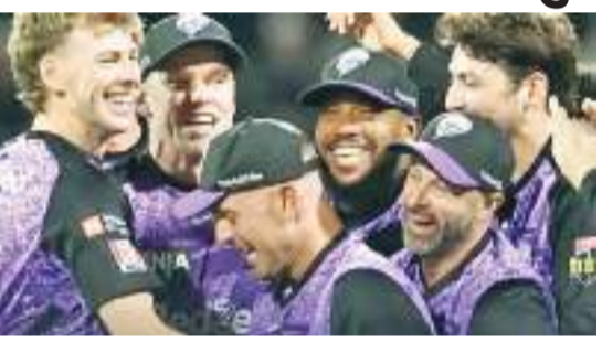
હોબાર્ટ તા 23

હોબાર્ટ હરિકેન્સ બિગ બેશ લીગ (BBL)ની 14મી સિઝનની ફાઇનલમાં પહોંચનારી પ્રથમ ટીમ બની ગઈ છે. ટીમે 7 વર્ષ બાદ ટાઇટલ મેચમાં જગ્યા બનાવી છે. મંગળવારે હોબાર્ટ ક્વોલિફાયરમાં ત્રણ વખતની ચેમ્પિયન સિડની સિક્સર્સને 12 રનથી હરાવ્યું હતું. પાવરપ્લેમાં 2 વિકેટ લેનાર ફાસ્ટ બોલર રિલે મેરેડિથ પ્લેયર ઓફ ધ મેચ રહ્યો હતો.