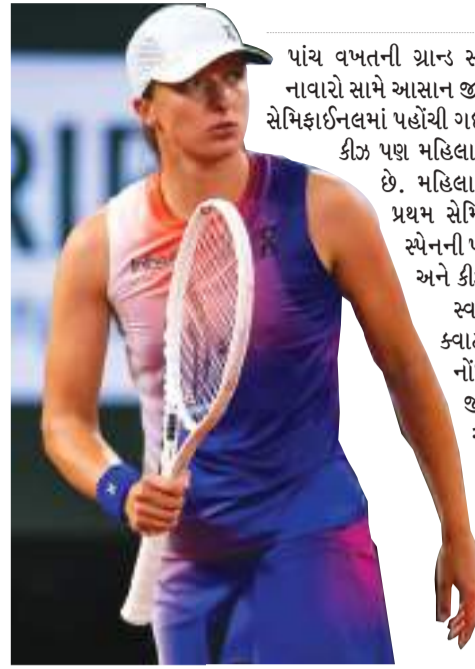
(એજન્સી) લંડન તા 23

પાંચ વખતની ગ્રાન્ડ સ્લેમ ચેમ્પિયન ઈગા સ્વાઇટેક અમેરિકાની એમ્મા નાવારો સામે આસાન જીત મેળવીને ઓસ્ટ્રેલિયન ઓપન મહિલા સિંગલ્સની સેમિફાઇનલમાં પહોંચી ગઈ છે. અમેરિકાની અન્ય એક ટેનિસ ખેલાડી મેડિસન કીઝ પણ મહિલા સિંગલ્સ ટુર્નામેન્ટની સેમિફાઇનલમાં પહોંચી ગઈ છે. મહિલા સિંગલ્સની સેમિફાઇનલિસ્ટ નક્કી થઈ ગઈ છે. પ્રથમ સેમિફાઇનલ વર્લ્ડ નંબર-1 આયોના સબલેન્કા અને સ્પેનની પોલા બરોસા વચ્ચે રમાશે. જ્યારે બીજી મેચ સ્વાઇટેક અને કીઝ વચ્ચે રમાશે.