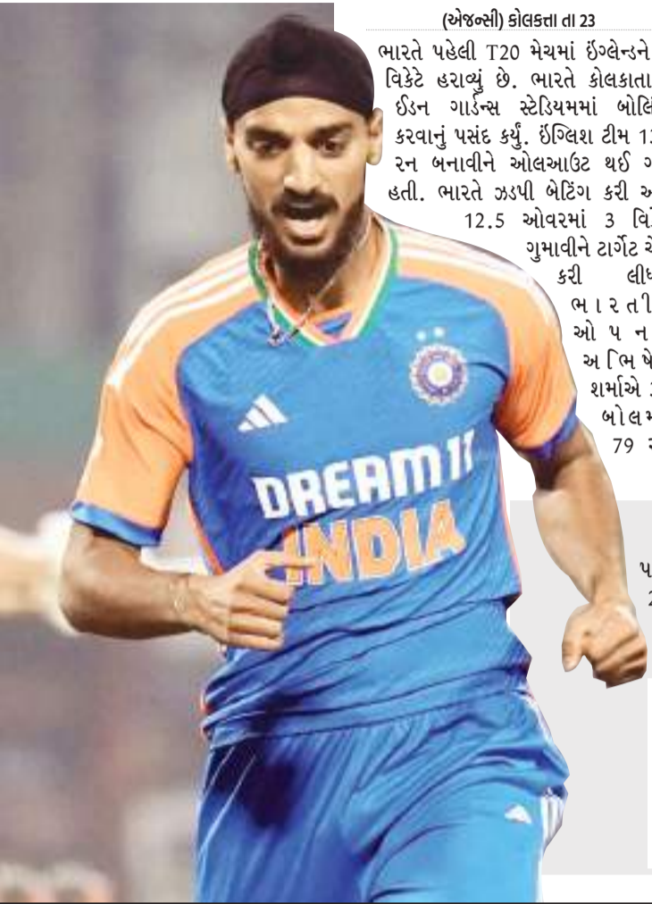
કોલકાતા તા 23

ભારતે પહેલી T20 મેચમાં ઈંગ્લેન્ડને 7 વિકેટે હરાવ્યું છે. ભારતે કોલકાતાના ઈડન ગાર્ડન્સ સ્ટેડિયમમાં બોલિંગ કરવાનું પસંદ કર્યું. ઈંગ્લિશ ટીમ 132 રન બનાવીને ઓલઆઉટ થઈ ગઈ હતી. ભારતે ઝડપી બેટિંગ કરી અને 12.5 ઓવરમાં 3 વિકેટ ગુમાવીને ટાર્ગેટ ચેજ કરી લીધો. ભારતીય ઓપનર અભિષેક શર્માએ 34 બોલમાં 79 રન