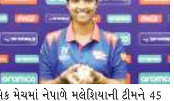
એક મેચમાં નેપાળે મલેશિયાની ટીમને 45 રનમાં આઉટ કરી દીધી હતી. બાદમાં ટીમે