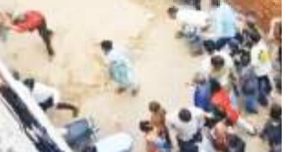
એક વખત ફૂતરાને લઈને પડોશી સાથે ઝઘડો થયો હતો અને ત્યારબાદ આસપાસના લોકો પણ ઉગ્ર રીતે મહિલાઓ સમક્ષ રજૂઆત કરતા દેખાયા હતા અને ત્યારબાદ સ્થાનિક લોકોએ પથ્થરમારો શરૂ કરી દીધો હતો. ઈંટોનો ઢગલો હોવાથી એક બાદ એક ઊંચકીને લોકોએ ફૂતરા પાળનાર પરિવારના ઘર ઉપર ફેંકવાની શરૂ કરી દીધી હતી. વાઈરલ થયેલા વીડિયોમાંથી પોલીસે ઈંટો મારનારા લોકોની ઓળખ મેળવી લીધી છે અને 6 આરોપીઓને ઝડપી પજા પાડ્યા છે. સ્થાનિક લોકોના કહેવા મુજબ ચાનો સોસાયટીમાં લોકોને કરડી રહ્યા છે અને તેના કારણે અનેક વખત ફરિયાદ પણ કરવામાં આવી છે.

સુરતના લિંબાયત વિસ્તારમાં આવેલા મારુતિનગરમાં ફૂતરા બાબતે પાડોશીઓ વચ્ચે બોલાચાલી બાદ પથ્થરમારના ઘટના બની હતી. એક પરિવારે ફૂતરાઓ રાખ્યા હોય અને તે લોકોને કરડતા હોય સ્થાનિકોએ આ બાબતે રજૂઆત કરી હતી. આ સમયે બોલાચાલી ઉગ્ર બની હતી. સ્થાનિક લોકોએ નજીકમાં પહોંચી ઈંટો અને પથ્થરો ઉપાડીને અન્ય પરિવારના ઘર પર ઘા કર્યા હતા. પોલીસે આ મામલે રામોટિંગનો ગુનો નોંધી વધુ તપાસ હાથ ધરી છે. સુરતના લિંબાયત મારુતિનગર વિસ્તારમાં એક પરિવારમાં ત્રણ મહિલાઓ રહેતી હોવાનું જાણવા મળ્યું