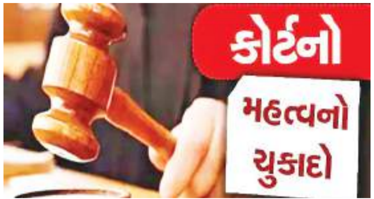
કોર્ટનો મહત્વનો ચુકાદો