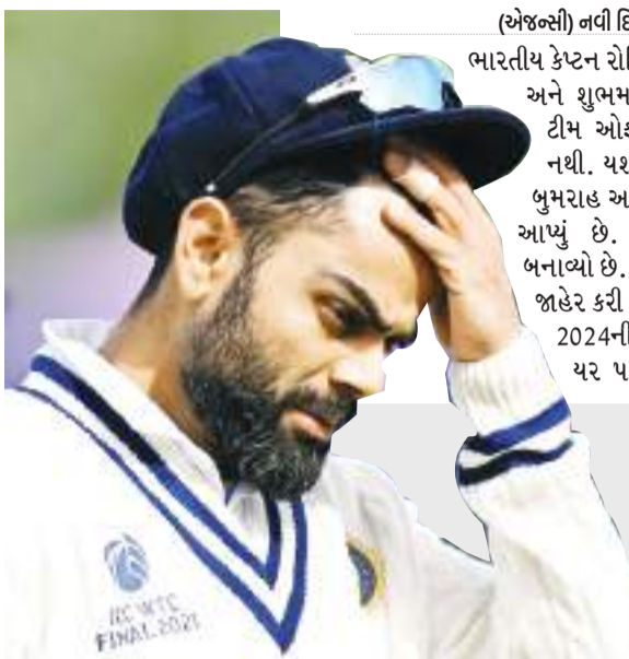
(એજન્સી) નવી દિલ્હી તા 25

ભારતીય કેપ્ટન રોહિત શર્મા, વિરાટ કોહલી અને શુભમન ગિલને ICCની ટેસ્ટ ટીમ ઓફ ધ યરમાં સ્થાન મળ્યું નથી. યશસ્વી જયસ્વાલ, જસપ્રીત બુમરાહ અને રવીન્દ્ર જાડેજાને સ્થાન આપ્યું છે. પેટ કમિન્સને કેપ્ટન બનાવ્યો છે. ICCએ શુક્રવારે આ ટીમ જાહેર કરી છે. ICC એ ટેસ્ટની સાથે 2024ની મેન્સ ODI ટીમ ઓફ ધ યર પણ જાહેર કરી છે. તેમાં