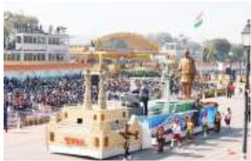
(એજન્સી) ગાંધીનગર | તા.29

76માં પ્રજાસત્તાક પર્વની રાષ્ટ્રીય પરેડમાં નવી દિલ્હીના કર્તવ્ય પથ ઉપર પ્રસ્તુત કરવામાં આવેલા ગુજરાતના ટેબલો 'આનર્તપુરથી એકતાનગર સુધી - વિરાસતથી વિકાસનો અદભૂત સંગમ'ને પોષ્યુલર ચોઈસ કેટેગરીમાં સૌથી વધુ મત પ્રાપ્ત થયા છે. ગુજરાતના ટેબલોએ પ્રજાસત્તાક દિન પરેડમાં પોષ્યુલર ચોઈસનું પ્રથમ સ્થાન સતત ત્રીજા વર્ષે પ્રાપ્ત કરીને હેટ્રિક સર્જ્ય છે.