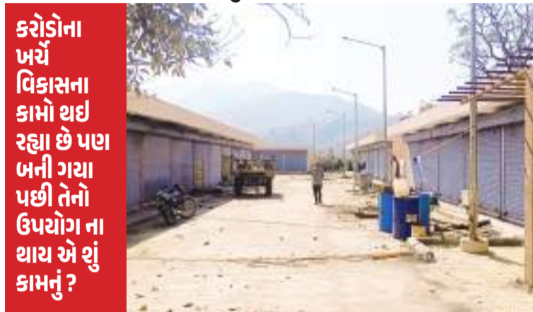
કરોડોના ખર્ચે વિકાસના કામો થઈ રહ્યા છે પણ બની ગયા પછી તેનો ઉપયોગ ના થાય એ શું કામનું?

સ્થાનિકો રોજગારીમાં તાપમાં બેસી આખો દિવસ ધંધો કરે છે, SOU સત્તામંડળ આ દુકાનો વહેલા ફાળવે તે જરૂરી