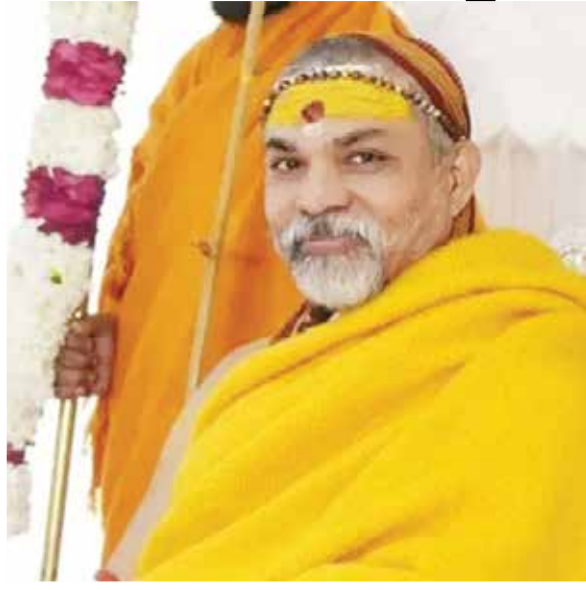
(અંજસી) પ્રયાગરાજ । તા. 04

બાગેશ્વર યામ સરકાર ધીરેન્દ્ર શાસ્ત્રીએ તાજેતરમાં એક નિવેદન આપ્યું હતું કે મહાકુંભ ભાગદોડમાં મૃત્યુ પામેલા લોકોએ મોક્ષ મળ્યો છે. તેમના આ નિવેદનની ચારેય તરફ ટીકા થઈ રહી છે. હવે ઉત્તરાખંડમાં જ્યોતિષ પીઠના શંકરાચાર્ય સ્વામી અવિમુક્તેશ્વરનંદ સરસ્વતીએ આ અંગે પ્રતિક્રિયા આપી છે. તેમણે જણાવ્યું હતું કે, 'આ રીતે મુક્તિ મળી શકતી નથી. જ્યારે લોકો સંકલ્પ લે છે અને પોતાનો જીવ આપે છે, ત્યારે તેમને મુક્તિ મળે છે; સંકલ્પ વિના મૃત્યુ મુક્તિ તરફ દોરી શકતું નથી.'