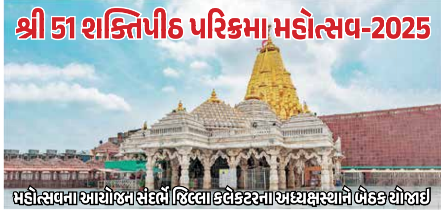
શ્રી 51 શક્તિપીઠ પરિક્રમા મહોત્સવ-2025

મહોત્સવના આયોજના સંવર્ભે જિલ્લા કલેક્ટરના અધ્યક્ષસ્થાને ભેટક યોજાઈ