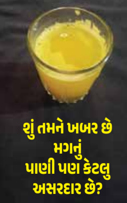
શું તમને ખબર છે મગનું પાણી પણ કેટલું અસરદાર છે?

દાળ નું ખીંડું કઢાઈ પર ઊંડા ચમચા થી પાથરી દ્યો. મગ ના પુડલા ને ઉલટ પુલટ કરીને પ્લેટ મા ટમેટા ની ચટણી સાથે પીરસો. મગ નું પાણી : મોટાભાગ ના લોકો ને મગ નું પાણી અંગે બે મત હોય છે. મગ નું પાણી એટલે છડી મગની દાળ કે ફોતરાવાળી મગની દાળ નું પાણી નહિ. મગનું પાણી ખાસ કરીને બિમાર વ્યક્તિ માટે બનાવવું હોય છે એટલે મગ નું પાણી વિશે સહેજ પણ ભ્રમણા હોય તો પ્રથમ ટિપ્સ લેવી જરૂરી છે. પ્રેશર કુકર માં માત્ર નાનકડી એક ચમચી મગ લઈને સહેજ મીઠું નાખી અને દોઢ ગ્લાસ પાણી ઉમેરી ને બાફી નાખવા. પ્રેશર કુકર ઠંડુ થયા બાદ બાફેલા મગ ને કાણા વાળા ચમચા થી તપેલી માં ગાળી નાખવું. તપેલી માં એકઠા થયેલ પાણી ને મગ નું પાણી માનવામાં આવે છે. તપેલી માંના મગ ના પાણી ને બાઉલ મા સહેજ ઘી ઉમેરી ને સર્વ કરો. ચમચા માં બચેલા મગ ને અન્ય ઉપયોગ માં લઈ શકાય છે. મિત્રો, મગ એ આરોગ્ય માટે અત્યંત જરૂરી છે નિયમિત સવાર સવાર માં ફ્લેગાવેલા મગ, ફોતરા વાળી મગ ની દાળ કે બાફેલા મગ નું સેવન કરશો તો એટલું નક્કી કે સમૃદ્ધ હેલ્થ સાથે વાળ, આંખ અને સ્કિન પણ તંદુરસ્ત બનશો..