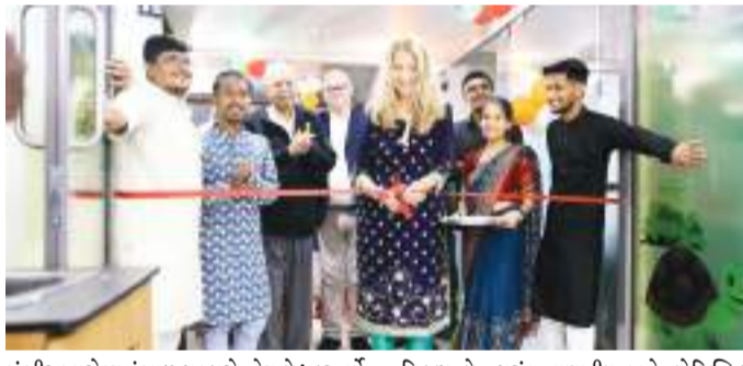
યુનિટને ભંડોળ આપીને, અમે જીવનરક્ષક સંભાળ તમારા નજીકના વિસ્તારમાં લઈ આવ્યા છીએ, આ રોગની સારવારમાં આવતા અવરોધો ઓછા કરવા અને એવા પરિવારોને સમર્થન આપવાનો પ્રયાસ કરી રહ્યા છીએ જેમને સારવાર લેવા માટે લાંબા અંતરની મુશ્કેલી કરવી પડે છે. અમારું સ્વપ્ન ભારતમાં થેલેસેમિયાથી પીડિત દરેક બાળકને નવજીવન આપવાનું છે - અને તેમનું સ્મિત પરત લાવવા, તેમની વૃદ્ધિ સાથે તેઓના સારા ભવિષ્યને સ્વીકારવાની એક કામ આપવા ઈચ્છીએ છીએ'. સંકલ્પ ઇન્ડિયા ફાઉન્ડેશનના પ્રમુખ રજત કુમાર અગ્રવાલે કહ્યું કે, '2018થી DKMS સાથેના અમારા સહયોગથી ભારતમાં 570થી વધુ બાળકોના જીવનમાં પરિવર્તન આવ્યું છે, અમદાવાદમાં આ નવા અને વિસ્તૃત યુનિટમાં દર વર્ષે 120 બાળકોની સારવાર કરવી શક્ય છે, અને તેનાથી વધુ સંખ્યામાં બાળકોના જીવન બચાવી શકાય છે અને તેઓ સુખી જીવન ફરીથી જીવી શકે છે.

(અંજન્સી) અમદાવાદ । તા. 08 ગુજરાતમાં થેલેસેમિયા દર્દીઓને યોગ્ય સારવાર આપવાના વિઝન સાથે, DKMS ફાઉન્ડેશન ઇન્ડિયા દ્વારા આજે અમદાવાદમાં નવા બોન મેરો ટ્રાન્સપ્લાન્ટ (BMT) યુનિટનું ઉદ્ઘાટન કરવામાં આવ્યું છે. ગુજરાત રાજ્યમાં સ્ટેમ સેલ ટ્રાન્સપ્લાન્ટેશનની જરૂરિયાત સતત વધી રહી છે અને તે જરૂરિયાત પૂર્ણ કરવા માટે, આ નવા કેન્દ્રમાં વિશિષ્ટ બાળરોગ 10 BMT બેડ, આવશ્યક એકેડેમીક સંભાળ સુવિધાઓ અને આઉટપેશન્ટ સેન્ટર પણ છે. આ કેન્દ્રમાં 4 ડોક્ટરો અને 14 નર્સો સહિત 26થી વધુ વ્યાવસાયિકો સેવા આપે છે જે દર્દીઓને શક્ય શ્રેષ્ઠ સંભાળ આપશે. આ નવા યુનિટનું સંચાલન, અમદાવાદની હેલ્થા સુપર સ્પેશિયાલિટી હોસ્પિટલના પરિસરમાં Cure2Childrenની તબીબી સલાહ સહાય સાથે બિન-લાભકારી સંસ્થા સંકલ્પ ઇન્ડિયા ફાઉન્ડેશન દ્વારા કરવામાં આવે છે. ભારતના લોકો સામે ગંભીર આરોગ્યસંભાળ પડકારો હોય છે: દર વર્ષે 12,000થી વધુ બાળકોને જન્મ સાથે થેલેસેમિયા રોગ હોય છે, જે વારસાગત રક્ત વિકૃતિ છે જેના લીધે ગંભીર એનિમિયા થાય છે. આવા બાળકોને ઘણીવાર આજીવન રક્તદાનની જરૂરિયાત હોય છે, અને જો તેઓને યોગ્ય સારવાર આપવામાં ન આવે તો, તે પૈકી ઘણા બાળકો 20 વર્ષથી વધુ સમય સુધી જીવત રહેતા નથી. તેમના માટે એકમાત્ર ઉપચાર બોન મેરો ટ્રાન્સપ્લાન્ટેશન વિકલ્પ છે, પરંતુ નાણાકીય અને લોજિસ્ટિકલ અવરોધોને કારણે અનેક લોકો માટે તેની એક્સેસ મર્યાદિત હોય છે. આ સારવારને વિસ્તૃત કરવા માટે, DKMS એ તેના એક્સેસ ટુ ટ્રાન્સપ્લાન્ટેશન પ્રોગ્રામ દ્વારા નવા BMT યુનિટને ભંડોળ આપવા માટે 31.15 મિલિયન ભારતીય રૂપિયા (આશરે 350,000 યુરો)ની સહાય માટે પ્રતિબદ્ધતા વ્યક્ત કરી છે. DKMSના ગ્લોબલ CEO ડૉ. એલેક્સ ન્યુજાદેરે કહ્યું કે, 'અમદાવાદમાં BMT