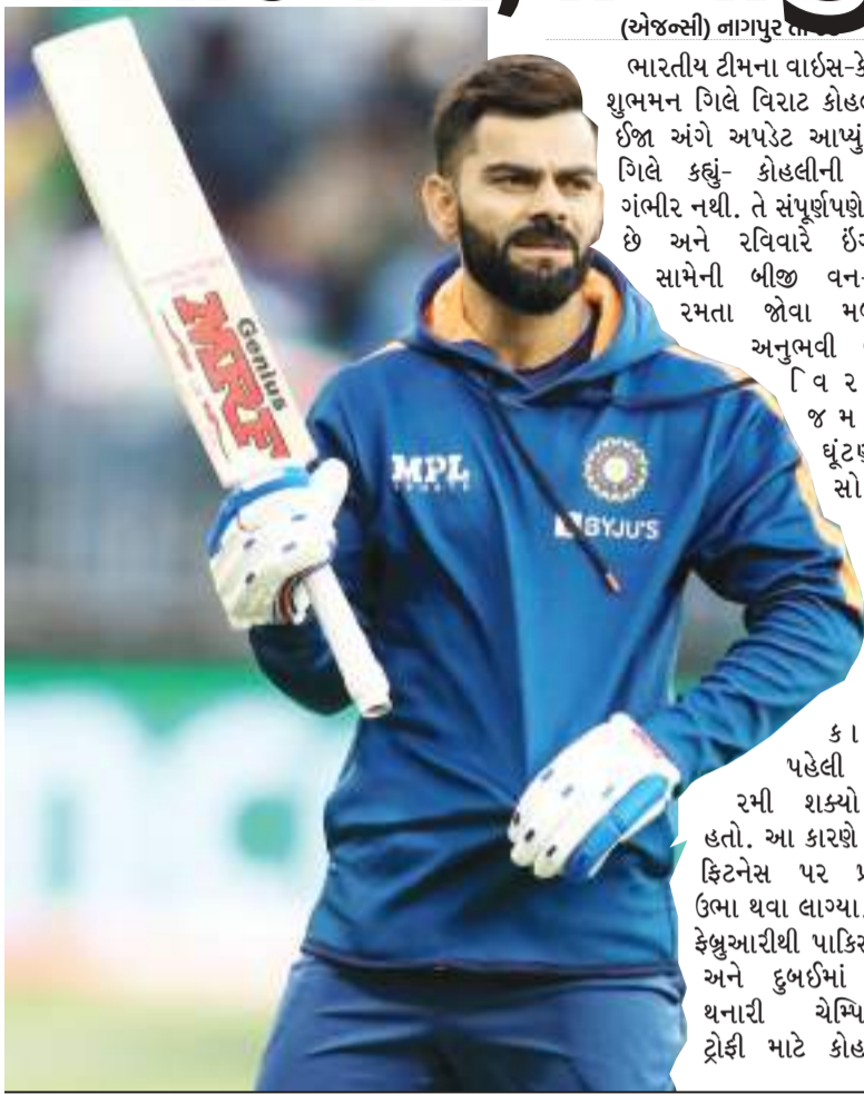
(એજન્સી) નાગપુર તા 08 ભારતીય ટીમના વાઈસ-કેપ્ટન શુભમન ગિલે વિરાટ કોહલીની ઈજા અંગે અપડેટ આપ્યું છે. ગિલે કહ્યું- કોહલીની ઈજા ગંભીર નથી. તે સંપૂર્ણપણે ફિટ છે અને રવિવારે ઈંગ્લેન્ડ સામેની બીજા વન-ડેમાં રમતા જોવા મળશે. અનુભવી બેટર વિરાટ કોહલીને ઈજા થઈ છે. તેને રવિવારે ઈંગ્લેન્ડ સામેની બીજા વન-ડેમાં રમવાની જગ્યા આપવામાં આવશે.

ભારતીય ટીમમાં સામેલ કરવામાં આવ્યો છે. 25 વર્ષીય ગિલે કહ્યું, 'તેની (કોહલી) ઈજા ગંભીર નથી.' બુધવારે તેણે સારી પ્રેક્ટિસ કરી, પરંતુ ગુરુવારે સવારે તેના ઘૂંટણમાં થોડો સોજો આવી ગયો. તે ચોક્કસપણે બીજા વન-ડેમાં પરત ફરશે.' ગિલે પોતાની ઈનિંગ્સ પર કહ્યું- 'હું પહેલી વન-ડેમાં સદીને ધ્યાનમાં રાખીને રમી રહ્યો ન હતો. હું ક્લિનિંગ વ્યવસ્થા પર ધ્યાન કેન્દ્રિત કરી રહ્યો હતો. હું તે મુજબ મારા શોટ્સ રમી રહ્યો હતો. હું બોલર પર પ્રભુત્વ મેળવવાનો પ્રયાસ કરી રહ્યો હતો. મને ત્રીજા નંબર પર બેટિંગ કરવામાં કોઈ સમસ્યા નથી.' નાગપુરમાં ઈંગ્લેન્ડ સામે ભારતની ચાર વિકેટની જીતમાં ગિલે મુખ્ય ભૂમિકા ભજવી હતી, જેમાં તેણે 87 રન બનાવ્યા હતા. યશસ્વી જયસ્વાલ 19 રન બનાવીને આઉટ થયા બાદ તે ત્રીજા નંબરે આવ્યો હતો. જ્યારે બીજા ઓપનર અને કેપ્ટન રોહિત શર્મા 2 રન બનાવીને પેવેલિયન પાછો ફર્યો ત્યારે તેણે ફક્ત 3 બોલ રમ્યા હતા. આવી સ્થિતિમાં, ગિલે શ્રેયસ અચ્ચર સાથે મળીને ઈનિંગની કમાન સંભાળી. બંનેએ ત્રીજા વિકેટ માટે 64 બોલમાં 94 રનની ભાગીદારી કરી. તેણે કહ્યું, 'હું ટેસ્ટમાં ત્રીજા નંબરે બેટિંગ કરું છું. તેથી મારે વધારે ગોઠવણો કરવાની જરૂર નહોતી. પહેલી વન-ડે મેચમાં વિરાટ કોહલીની જગ્યાએ ગિલ નંબર-3 પર બેટિંગ કરવા આવ્યો હતો.'