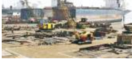
જાન્યુઆરી માસમાં અલંગમાં માત્ર ૧૦ શિપ બીચ થયાં છે. જે છેલ્લા એક દાયકામાં સૌથી ઓછા છે. વર્ષ-૨૦૧૬ના જાન્યુઆરી માસમાં અલંગમાં ૩૬ શિપ આમરી સફરે આવ્યા હતા. જેમાં છેલ્લા ૧૦ વર્ષ દરમિયાન ઘટાડો જોવા મળ્યો છે, વર્ષ-૨૦૧૬ના જાન્યુઆરી માસની સરખામણીએ ચાલુ વર્ષના જાન્યુઆરી માસ સુધીમાં અલંગમાં આવતા શિપની સંખ્યામાં ૭૨.૨૩ ટકાનો ઘટાડો થયો છે. અલંગમાં છેલ્લા એક દાયકાના જાન્યુઆરી માસમાં ચાલુ વર્ષ ૨૦૨૫ના જાન્યુઆરી માસમાં સૌથી ઓછા શિપ આવ્યા છે.