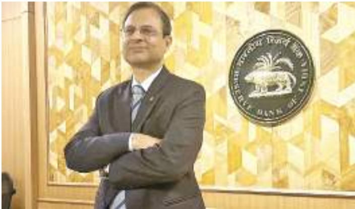
પકડી રાખવાનું ગમશે અને ભારત સાત ટકા અને તેથી ઊંચો આર્થિક વિકાસ દર

(એજન્સી) મુંબઈ | તા.08 સાત ટકાથી વધુનો આર્થિક વિકાસ દર ડાંસલ કરવા માટે ભારત સક્ષમ છે અને દેશના લોકોએ આ માટે આશા પણ રાખવી જોઈએ એમ રિઝર્વ બેન્કના ગવર્નર સંજય મલ્હોત્રાએ જણાવ્યું હતું. વર્તમાન નાણાં વર્ષ માટે નાણાં નીતિની અંતિમ દ્વીમાસિક સમીક્ષા બેઠકના અંતે રિઝર્વ બેન્કે આગામી નાણાં વર્ષ માટે દેશનો આર્થિક વિકાસ દર ૬.૭૦ ટકા અને વર્તમાન નાણાં વર્ષ માટે ૬.૪૦ ટકા રહેવાનો અંદાજ મૂક્યો છે. જો કે હાલની વૈશ્વિક અનિશ્ચિતતાને ચિંતાના વિષય તરીકે ગણાવી હતી. મને મારા શબ્દો