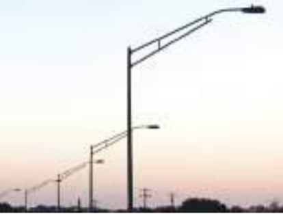
હોવાના કારણે નવી લાઈટ કે સર્કિટ મંગાવી શકાતી નથી. એકાદ બીલમાં સહી થાય તો તે બીલની રકમ ઉધારવાવામાં વેપારીઓને પરસેવો છૂટી જાય છે. જેના કારણે વેપારીઓ પણ માલ-સામાન આપવા તૈયાર થતા નથી. આવી સ્થિતિમાં લોકો રોજેરોજ હાડમારી વેકી રહ્યા હોય, ન.પા. તંત્ર દ્વારા સ્ટ્રીટલાઈટનો ઘટતો સામાન વહેલી તકે મંગાવી રોશની વિભાગને કામે લગાડી તમામ બંધ સ્ટ્રીટલાઈટને રાટ્ કરી શહેરમાં અજવાળું કરવામાં આવે તેવી જનતામાં પ્રબળ માંગણી ઊઠી છે.

સિહોર : સિહોર શહેરમાં નગરપાલિકા તંત્રના અંધર વહીવટનો વધુ એક નમૂનો સામે આવ્યો છે. શહેરમાં ૩૦ ટકા જેટલી સ્ટ્રીટલાઈટો બંધ હોવાથી અંધકારના ઓળા ઉતર્યાં છે. જેના કારણે રાત્રિના સમયે લોકોને પારાવાર મુશ્કેલીનો સામનો કરવો પડી રહ્યો છે. અસંખ્ય વખત ફરિયાદો કરવા છતાં પાલિકા તંત્રનું પેટનું પાણી હલતું ન હોય, સિહોરવાસીઓમાં રોષની લાગણી ફેલાઈ છે. છોટેકાશી તરીકે વિખ્યાત સિહોરના કેટલાક વિસ્તારોમાં ઘણાં સમયથી સ્ટ્રીટલાઈટો બંધ પડી છે. રોજેરોજ સ્ટ્રીટલાઈટ બંધ હોવાની અનેક ફરિયાદો કરવા ન.પા.ના અધિકારીઓ કાને વાત ધરતા નથી. શહેરની ફરિયાદ કરવા જાય તો સ્ટ્રીટલાઈટનો માલ-સામાન હાજર સ્ટોકમાં ન હોવાથી સ્ટ્રીટલાઈટ બંધ હોવાનો ઉડાઉ જવાબ આપવામાં આવતો હોવાની રાવ ઊઠી છે. શહેરના કેટલાક વિસ્તારોમાં અંધકારના ઓળાના કારણે તસ્સરોને મોકળું મેદાન મળી ગયું છે અને ચોરીના બનાવોમાં ચિંતાજનક રીતે વધારો થયો છે. માલ-સામાનના અભાવે સ્ટ્રીટલાઈટો બંધ હોવાના કારણમાં એવું પણ લોકોમાં ચર્ચાઈ રહ્યું છે કે, ચીફ ઓફિસર દ્વારા બીલોમાં સહી કરવામાં આવતી ન