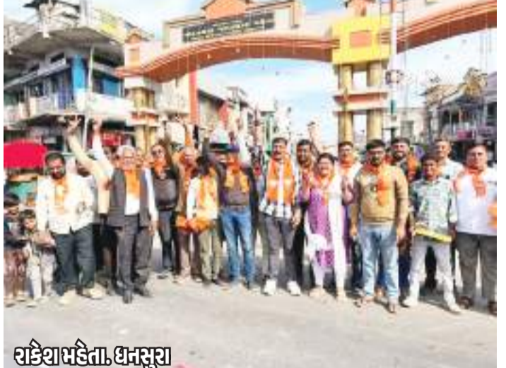
રક્ષિયા મહિતા, ધનસુરા દિલ્હી વિધાનસભાની ચૂંટણી યોજાઈ હતી. જેનું પરિણામ જાહેર થતા ભારતીય જનતા પાર્ટીની તમ્બ જીત થઈ છે. જેને લઈને અરવલ્લી જિલ્લાના ધનસુરા ભાજપના પ્રમુખ. હોદ્દેદારો. આગેવાનો, કાર્યકરોએ ચારસ્તા ફટકા ફોડી વિજયોત્સવ મનાવ્યો હતો.