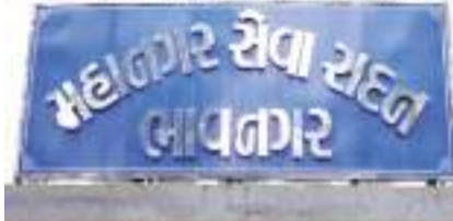
નામદાર હાઈકોર્ટ સમક્ષ બચાવ/રજૂઆતની કામગીરી કરવા કુલ-૬ પેનલ એડવોકેટોની નિમણૂક કરવામાં આવેલ છે. નામદાર કોર્ટ સમક્ષના પેનલિંગ કેસોની લીગલ વિભાગ દ્વારા સતત સંબંધિત વિભાગના સંપર્કમાં રહી એડવોકેટો સાથે સમીક્ષા કરવામાં આવે છે. જેના કારણે અગાઉ વર્ષ-૨૦૨૨ માં પેનલિંગ કુલ-૮૬૨ કેસો પૈકી હાલ કુલ-૬૩૫ કેસો પેનલિંગ રહેવા પામેલ છે એટલે કે પાછલા ત્રણ વર્ષોમાં પેનલિંગ કેસોમાં કુલ-૨૨૭ કેસોનો નોંધપાત્ર ઘટાડો થયેલ છે. મહાપાલિકા સામેના કુલ ૨૮ કેસનો નિકાલ થયો છે, જેમાં ૨૭ કેસમાં મહાપાલિકાની તરફેણમાં ચુકાદા આવ્યા છે તેમ ભાવનગર મહાપાલિકાના લીગલ ઓફિસરે માહિતી આપતા જણાવેલ છે.

(અંજન્સી) લાવનગર । તા. 08 સરકારી તંત્રની સામે કોઈને કોઈ કારણોસર અરજદારો દ્વારા કોર્ટમાં કેસ દાખલ કરવામાં આવતા હોય છે અને આ કેસના ચુકાદા તંત્રની તરફેણમાં આવે તે માટે પ્રયાસ કરવામાં આવતા હોય છે, આવું જ કામ ભાવનગર મહાપાલિકાના લીગલ વિભાગ દ્વારા કરવામાં આવતું હોય છે. મહાપાલિકા સામે જુદા જુદા કારણોસર ઘણા કેસ થયા છે, જેમાં કેટલાક કેસ ચાલી જતા મહાપાલિકાની તરફેણમાં ચુકાદા આવ્યા છે અને હજુ ઘણા કેસ પેનલિંગ છે. ભાવનગર મહાનગરપાલિકાના લીગલ વિભાગ હસ્તક નામદાર સુપ્રિમ કોર્ટ, નામદાર ગુજરાત હાઈકોર્ટ, નામદાર હાઈકોર્ટ/સેશન્સ અદાલતો, નામદાર સીવીલ કોર્ટ, નામદાર કન્સ્યુમર કોર્ટ, નામદાર લેબર કોર્ટ, નામદાર ઔદ્યોગિક અદાલત વગેરે જેવી ન્યાયાધિક/અર્થન્યાયાધિક સત્તાઓ સમક્ષ ભાવનગર મહાનગરપાલિકાને સંલગ્ન કેસો અંગે બચાવ/રજૂઆતની કામગીરી કરવામાં આવે છે. જેમાં નામદાર હાઈકોર્ટ/સેશન્સ અદાલત સમક્ષ બચાવ/રજૂઆતની કામગીરી કરવા કુલ-૬ પેનલ એડવોકેટો આવી