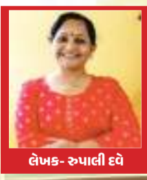
લેખક - રુપાલી દવે