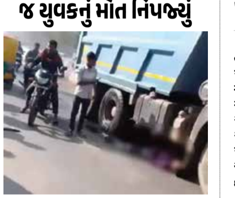
(એજન્સી) અમદાવાદ | તા.13

અમદાવાદ શહેરમાં ફરી એકવાર અકસ્માતના બનાવમાં નિર્દોષ વ્યક્તિએ પોતાનો જીવ ગુમાવ્યો છે. શહેરના વટવા વિસ્તારમાં એક્ટિવા પર જતા યુવકને ડમ્પરે કચડી નાખ્યો હતો. જેમાં યુવકનું ઘટનાસ્થળે જ મોત નીપજ્યું છે. આ સમગ્ર બનાવની જાણ થતા ટ્રાફિક પોલીસ ઘટનાસ્થળે પહોંચી હતી. હાલ ટ્રાફિક પોલીસે આ મામલે ગુનો નોંધી વધુ તપાસ હાથ ધરી છે. પોલીસ પાસેથી મળતી માહિતી પ્રમાણે આજે સવારે એક્ટિવા લઈને એક યુવક વટવા કેનાલ તરફ પસાર થઈ રહ્યો હતો. તે સમયે ડમ્પરે એક્ટિવા ચાલકને અડકેટે લીધો હતો. અકસ્માતમાં ડમ્પરના ટાયર ફરી વળતા એક્ટિવા ચાલકનું ઘટનાસ્થળે મોત નીપજ્યું હતું. આ બનાવ થયા બાદ આસપાસના લોકો ભેગા થવા લાગ્યા હતા અને 108ને જાણ કરી હતી. પરંતુ યુવકનું મોત થયા બાદ ટ્રાફિક પોલીસની ટીમ ત્યાં પહોંચી હતી. આ બનાવો અંગે ટ્રાફિક પોલીસે અકસ્માતે મોતનો બનાવ નોંધી તપાસ શરૂ કરી છે. જ્યારે ડમ્પરના ચાલકની ધરપકડ કરવા માટે પ્રયાસો શરૂ કર્યા છે. ઉલ્લેખનીય છે કે, અનેક વખત ડમ્પરની અડકેટ નિર્દોષ લોકોના મોત નીપજે છે. તે સમયે શહેરમાં ડમ્પરના અવરજવરને લઈને અનેક વિવાદો અગાઉ ઊભા થયા છે.