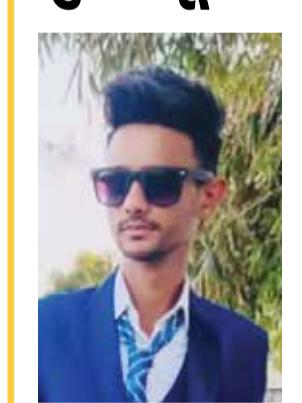
(એજન્સી) અમદાવાદ | તા.13

અમદાવાદના સરખેજ વિસ્તારમાં મોડીરાતે યુવકની ઘાતકી હત્યા કરવામાં આવી હોવાનો બનાવ સામે આવ્યો છે. યુવકે પૂર્વ પ્રેમિકાના કાકાની છરીના ઘા ઝીંકીને હત્યા કરી હતી. યુવક તેના સાળાના ઘરે પ્રસંગમાં આવ્યો ત્યારે તે પૂર્વ પ્રેમિકાના ઘરે બુલેટ લઈને અવારનવાર પસાર થતો હતો અને હોર્ન મારતો હતો. પ્રેમિકાના કાકાએ યુવકને ઠપકો આપ્યો ત્યારે મામલો બીચક્યો હતો અને છરીના ઘા ઝીંકી દીધા હતા. શહેરમાં બે દિવસમાં ત્રણ હત્યાના બનાવ બન્યા છે.