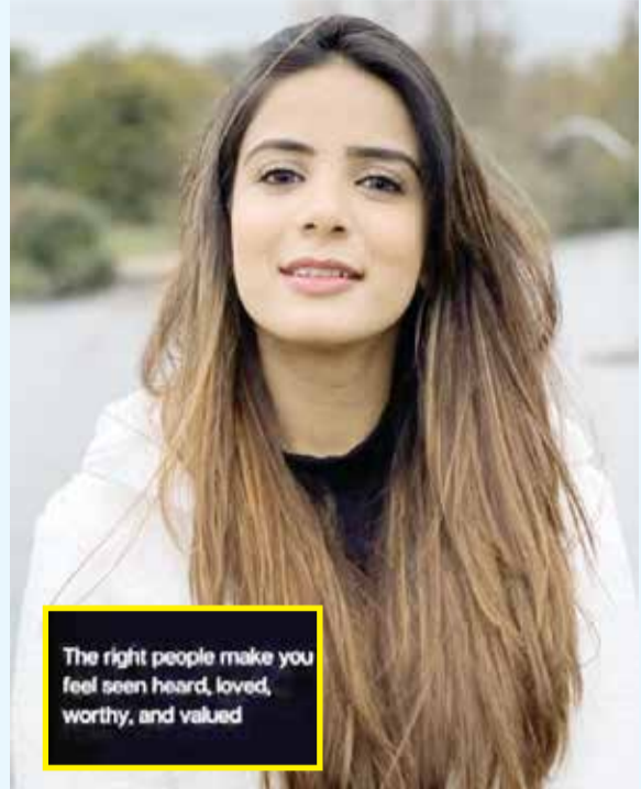
The right people make you feel seen, heard, loved, worthy, and valued

રૂમ્સ ગલફેન્ડે કર્યો અનફોલો, 'ઇન્ડિયાઝ ગોટ લેટેસ્ટ'ને કારણે રિલેશનશીપ તૂટ્યાં...?