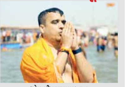
(એજન્સી) પ્રયાગરાજ | તા.13

પ્રયાગરાજમાં ચાલતા મહાકુંભ મેળામાં કરોડો ભક્તોએ પવિત્ર ડૂબકી લગાવી છે, ત્યારે હવે ગુજરાતના ગૃહ રાજ્યમંત્રી હર્ષ સંઘવીએ પણ પ્રયાગરાજના મહાકુંભમાં સ્નાન કર્યું છે. ગુજરાતના ગૃહ રાજ્યમંત્રી હર્ષ સંઘવીએ પણ પ્રયાગરાજના મહાકુંભમાં સ્નાન કર્યું છે. હર્ષ સંઘવીએ સંત, સેવા અને સ્નાનનો મહિમા ધરાવતા સતુઆ બાબા સેવા શિબિરની મુલાકાત લીધી હતી.