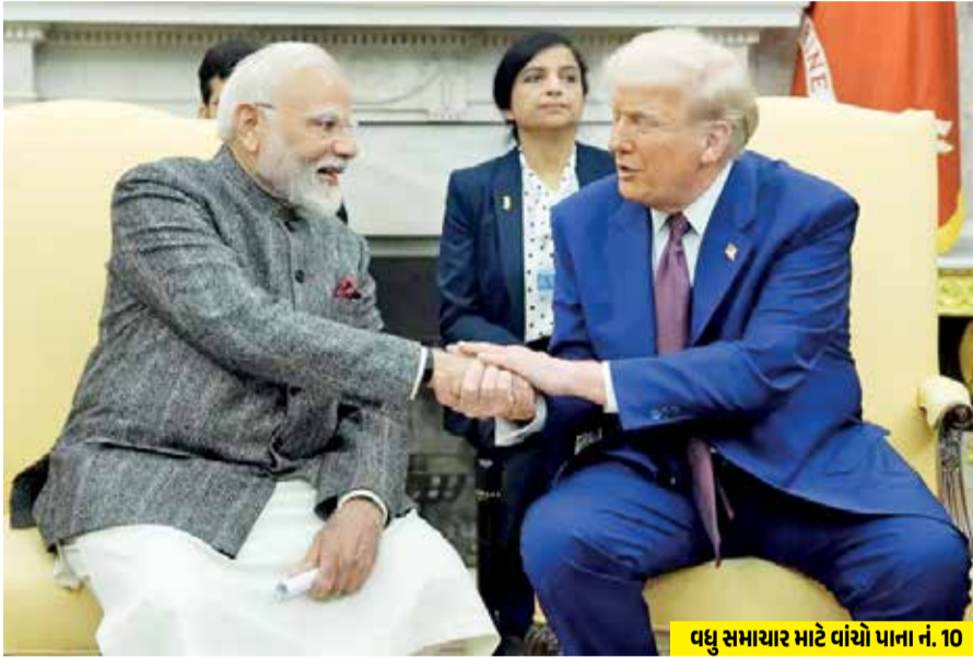
વધુ સમાચાર માટે વાંચો પાના નં. 10

(એજન્સી) ન્યૂયોર્ક | તા. 14 વડાપ્રધાન મોદી અને યુએસ પ્રમુખ ડોનાલ્ડ ટ્રમ્પ ગુરુવારે મોડી રાત્રે (ભારતીય સમય મુજબ શુક્રવારે સવારે 3 વાગ્યે) વ્હાઈટ હાઉસમાં મળ્યા હતા. બંને દેશો વચ્ચે મિત્રતા, રશિયા-યુક્રેન યુદ્ધ અને અન્ય મહત્વપૂર્ણ મુદ્દાઓ પર બંને નેતાઓ વચ્ચે ચર્ચા થઈ હતી. વડાપ્રધાન નરેન્દ્ર મોદી સાથે પ્રેસ કોન્ફરન્સમાં હાજર અમેરિકાના રાષ્ટ્રપ્રમુખ ડોનાલ્ડ ટ્રમ્પે ભારતીય પત્રકારની વાતો અને સવાલ સમજાયા ન હોવાનો ડોળ કર્યો હતો. તેમણે અમેરિકામાં ભારત વિરોધી ગતિવિધિઓ અંગે પુછવામાં આવેલા પ્રશ્નોનો કોઈ સ્પષ્ટ જવાબ આપ્યો ન હતો. જો કે, આ પહેલાંવાર નથી જ્યારે ટ્રમ્પે પત્રકારના ઉચ્ચાર અથવા બોલવાની રીત પર સવાલ ઉઠાવ્યા હોય.