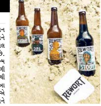
આ પહેલાં 2019માં એક ઈકરાચાલીની કંપનીને પોતાની દારૂની બોટલ પર ગાંધીની તસવીર લગાવવા માટે ફટકાર લગાવવામાં આવી હતી. આ ઘટના ત્યારે સામે આવી જ્યારે રાજ્યસભાના સભ્યોએ દારૂની બોટલો પર મહાત્મા ગાંધીની તસવીરના આવા ઉપયોગની ચિંતા વ્યક્ત કરી.

(એજન્સી) મોસ્કો | તા. 14 મહાત્મા ગાંધી, મધર ટેરેસા અને નેલ્સન મંડેલા જેવી મહાન વ્યક્તિઓની બિયર અને દારૂની બોટલ પર છાપાયેલી તસવીર હાલ સોશિયલ મીડિયા પર વાયરલ થઈ રહી છે. તેનાથી લોકો વચ્ચે એક નવા વિવાદે જન્મ લીધો છે. આ સિવાય ગાંધીજીના ફોટાવાળી બિયરની બોટલ પર ઝંડા દર્શાવ્યું હોવાથી લોકોની ધાર્મિક ભાવના પણ દુભાઈ છે. આ કૃત્ય રશિયાની એક દારૂ બનાવનાર કંપનીએ કર્યું છે. રશિયાની કંપનીની આ હરકતને લઈને એવું પણ જણાવવામાં આવ્યું કે, આ કોઈ નવી AI જનરેટેડ બિયરની બોટલના ફોટા નથી. હકીકતમાં બિયરની બોટલ અને કેન પર આ મહાન લોકોની તસવીર લગાવવામાં આવી છે.