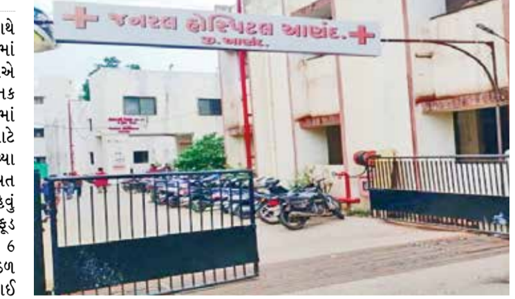
તમામની તબિયત સુધારા પર છે.ત્યારે તાપમાન 32 થી 35 ડિગ્રી સેલ્સિયસથી કેલ્થ વિભાગના અધિકારીઓ પણ ઘટના સ્થળે પહોંચ્યા હતા,તમામ બાળકો પરપ્રાંતિય છે અને મજૂરી કામે માતા-પિતા સાથે આવ્યા છે.જ્યારે

આણંદના આંકલાવમાં 6 બાળકો સાથે ફૂડ પોઈઝનિંગની ઘટના બની છે. જેમાં પરપ્રાંતિય પરિવારના 6 બાળકોએ અજાણ્યું ફૂળ ખાઈ લેતા અચાનક વોમિટિંગ શરૂ થઈ ગઈ હતી જેમાં તમામ બાળકોને સારવાર માટે હોસ્પિટલમાં ખસેડવામાં આવ્યા છે.હાલ તમામ બાળકની તબિયત સુધારા પર છે તેવું ડોક્ટરનું કહેવું છે.આણંદના આંકલાવમાં ફૂડ પોઈઝનિંગની ઘટના બની છે જેમાં 6 બાળકોને તાત્કાલિક સારવાર હેઠળ ખસેડવામાં આવ્યા છે.કોઈ ફળ ખાઈ લેતા આ ઘટના બની છે,બાળકોને હાલમાં હોસ્પિટલમાં ખસેડવામાં આવ્યા છે અને અલગ-અલગ રીપોર્ટ કાઢવામાં આવ્યા છે,બાળકોને તાત્કાલિક સારવાર મળી રહેતા