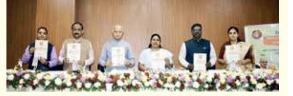
ગાંધીનગર સંવાદદાતા | વિજયવીર યાદવ

સેન્ટ્રલ યુનિવર્સિટી ઓફ ગુજરાતનાં સ્કૂલ ઓફ નેનો સાયન્સ દ્વારા એક દિવસીય રાષ્ટ્રીય પરિસંવાદનું આયોજન કરવામાં આવ્યું હતું. મંગળવારે વડોદરાના કુંદલા ખાતે યુનિવર્સિટી કેમ્પસમાં આયોજિત “પર્યાવરણ, આરોગ્ય અને કૃષિ માટે બાયોકેમિસ્ટ્રી અને નેનોટેકનોલોજી” વિષય પર રાષ્ટ્રીય સેમિનારમાં, યુનિવર્સિટીના કુલપતિ સમારંભના અધ્યક્ષ પ્રો. રમાશંકર દુભેએ વૈશ્વિક પરકારોનો સામનો કરવામાં બાયોકેમિસ્ટ્રી અને નેનોટેકનોલોજીની પરિવર્તનશીલ ભૂમિકા પર ભાર મૂક્યો. તેમણે પર્યાવરણ, આરોગ્ય અને કૃષિ ક્ષેત્રોમાં કામ કરવા પર ભાર મૂક્યો. પરિસંવાદના સંયોજક અને સ્કૂલ ઓફ નેનો સાયન્સના ડીન, પ્રો. પલ્લવી શર્માએ સ્વાગત પ્રવચન કર્યું હતું. ઉદ્ઘાટન સત્રના મુખ્ય મહેમાન સિદ્ધાર્થ યુનિવર્સિટી, કપિલવસ્તુના વાઈસ ચાન્સેલર પ્રો. કવિતા શાહે નેનો ટેકનોલોજી દ્વારા સ્વચ્છ અને ટકાઉ ભવિષ્ય તરફ યોગદાન આપવાની ચર્ચા કરી. આ દરમિયાન, બનારસ હિન્દુ યુનિવર્સિટીના બાયોકેમિસ્ટ્રી વિભાગના ભૂતપૂર્વ વડા પ્રો. પરપરાગત ઓષધિઓ અને નેનોપાર્ટિકલ્સનો ઉપયોગ અંગે માહિતી આપતાં સૂર્ય પ્રતાપ સિંહે જણાવ્યું હતું કે નેનોપાર્ટિકલ્સ ન્યુરોપ્રોટેક્શન અને પાર્કિન્સન રોગની સારવારમાં મદદરૂપ થાય છે.