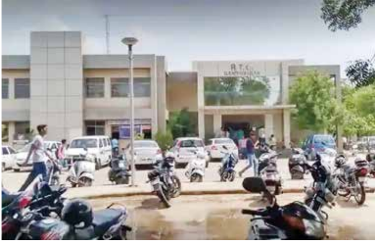
લાયસન્સ કાઢી આપવા જેવી મહત્વની જવાબદારી જ આરટીઓ પાસે રહી છે તેવી સ્થિતિ વચ્ચે પણ ગાંધીનગર આરટીઓની આવક સતત વધી રહી છે એટલુ જ નહીં, સરકાર દ્વારા આપવામાં આવતા ટર્ગેટ કરતા પણ આવકમાં વધારો થયો છે જે નોંધનીય

બાબત છે. ત્યારે આ આવકમાં મહત્વનો હિસ્સો ઇમ્પોર્ટ કરેલા એટલે કે, વિદેશમાંથી ગાંધીનગર રજીસ્ટ્રેશન માટે આવતા વાહનોનો છે. સામાન્યરીતે વિદેશમાં જે તે વાહનની મુળ કિંમત હોય તેના ૧૨ ટકા જેટલો ટેક્સ આ વાહનના માલિક પાસેથી વસુલવામાં આવે છે અને તે ટેક્સ ભરાયા બાદ જ જે તે માલિકને તેનું વાહન રજીસ્ટર્ડ કરી આપવામાં આવશે. ગાંધીનગર આરટીઓ દ્વારા વર્ષ ૨૦૨૩-૨૪માં આવા કુલ ૧૨૫ વિદેશી વાહનોનું રજીસ્ટ્રેશન કરીને તેમાંથી ૧૨ ટકા ટેક્સની કુલ ૧૩.૨૮ કરોડની આવક કરી હતી. આવી જ રીતે વર્ષ ૨૦૨૪-૨૫માં અત્યાર સુધી ૧૧૪ વાહનોના માલિકો પાસેથી ૧૪.૪૬ કરોડ મળીને તે વર્ષ દરમ્યાન કુલ ૨૩૯ વિદેશી વાહનોના રજીસ્ટ્રેશનમાંથી આરટીઓને કુલ ૨૭.૭૭ કરોડની આવક થઈ છે.