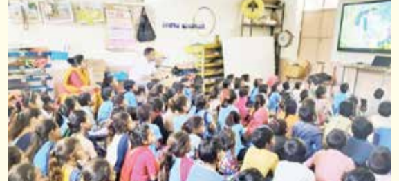
માહિતી વ્યુરો, પાલનપુર

ગુજરાત વન નિર્માણ વિકાસ યોજના હેઠળ ઈકો ક્લબની શાળાઓમાં વિદ્યાર્થીઓને પર્યાવરણ પ્રત્યે જાગૃતિ કેળવવાય તે હેતુથી બનાસકાંઠા વન્યપ્રાણી વિભાગ હેઠળની દાંતા રેન્જની વિવિધ શાળાઓમાં જાગૃતિ અભિયાન યોજવામાં આવ્યું હતું. દાંતા તાલુકાની પી.એમ.શ્રી, મોડલ સ્કૂલ, જગતાપુરા સહિત વિવિધ શાળાઓમાં વિશેષજ્ઞો દ્વારા પ્રવચન, ફિલ્મ શો/માહિતીનું આદાન-પ્રદાન અને નિબંધ લેખન, ચર્ચા સહિતની પ્રવૃત્તિઓ હાથ ધરાઈ હતી. ઈકો-ક્લબ આધારિત પ્રકૃતિ શિક્ષણની પ્રવૃત્તિઓ એ ગુજરાત ઈકોલોજીકલ એજ્યુકેશન એન્ડ રિસર્ચ ફાઉન્ડેશન (GEER)ના મુખ્ય કાર્યક્રમો પૈકીનો એક છે. આ પેટા - ઘટકનો અમલ ગુજરાત ઈકોલોજીકલ એજ્યુકેશન એન્ડ રિસર્ચ ફાઉન્ડેશન (GEER) દ્વારા હાથ ધરવામાં આવે છે. દાંતા રેન્જના કાર્યક્ષેત્રની શાળાઓમાં શાળાના બાળકોને વન્યજીવ અને પર્યાવરણ વિશે માહિતગાર કરાયા હતા.