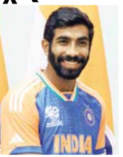
બુમરાહ બહાર હોવાથી ટીમ ઈન્ડિયાને મોટો ફટકો પડ્યો છે. બુમરાહની ગેરહાજરીમાં ભારતની બોલિંગ તાકાત ઘટી ગઈ છે. ઓસ્ટ્રેલિયાનો રેગ્યુલર કેપ્ટન અને સ્ટાર ફાસ્ટ બોલર પેટ કમિન્સ પગની ઘૂંટીની

ઈજાને કારણે ચેમ્પિયન્સ ટ્રોફીમાંથી બહાર થઈ ગયો છે. તેની ગેરહાજરીથી ઓસ્ટ્રેલિયાના પેસ આક્રમણને ફટકો પડ્યો છે. ડાબોડી ઓસ્ટ્રેલિયન ફાસ્ટ બોલર મિશેલ સ્ટાર્ક અંગત કારણોસર ચેમ્પિયન્સ ટ્રોફીમાંથી પોતાનું નામ પાછું ખેંચી લીધું છે. સ્ટાર્કની ગેરહાજરીમાં ચેમ્પિયન્સ ટ્રોફીમાં ઓસ્ટ્રેલિયાનું પેસ આક્રમણ વધુ નબળું થઈ ગયું છે. ચેમ્પિયન્સ ટ્રોફીમાંથી બહાર થનારા ચોથો ઓસ્ટ્રેલિયન પેલાડી છે ઓલરાઉન્ડર મિશેલ માર્શ. માર્શને પણ ઈજા થઈ છે જેના કારણે તેને ટુર્નામેન્ટમાંથી બહાર થવું પડ્યું છે.