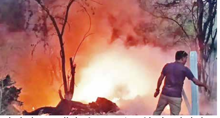
લાગ્યો હતો અને ધુમાડા ના ગોટે ગોટા નીકળવા લાગ્યા હતા ત્યારે આગનો કોલ ફાયર બ્રિગેડને આપવામાં આવ્યો હતો દોડી આવેલા ફાયર બ્રિગેડે. આગ ઉપર પાણીનો મારો ચલાવ્યો હતો અને આગ ઉપર કાબુ મેળવ્યો હતો આગ ઉપર કાબુ મેળવી લેતા હાજર લોકોએ હાશકારો વ્યક્ત કર્યો હતો.

કલોલના પ્રતાપપુરા ગામે શહેરના ન્યુ પંચવટી વિસ્તારને અડીને ગૌચર જમીનમાં કચરાના ઢગલામાં આગ લાગી હતી જેના પગલે દોડધામ મચી ગઈ હતી કોઈ કેમિકલ વાળો કચરો અહીં નાખી ગયું હતું જેમાં આગ લાગી હતી આગનો કોલ ફાયર બ્રિગેડને આપવામાં આવતા ફાયર બ્રિગેડની ટીમ દોડી આવી હતી અને આગ ઉપર પાણીનો મારો ચલાવ્યો હતો અને આગ ઉપર કાબુ મેળવ્યો હતો. આ બાબતે મળતી વિગતો અનુસાર કલોલના ન્યુ પંચવટી વિસ્તારમાં આગની ઘટના બની હતી જેના પગલે દોડધામ મચી ગઈ હતી ન્યુ પંચવટી વિસ્તારમાં પ્રતાપપુરા ગામ ની ગૌચર જમીનમાં કોઈ કચરો નાખી ગયું હતું આ કચરો કેમિકલ વાળો હોવાથી આગ લાગી હતી એકાએક આગ લાગતા દોડધામ મચી ગઈ હતી અને જ્યોત જોતામાં આગે વિકરાળ સ્વરૂપ ધારણ કર્યું હતું અને કચરો સળગવા