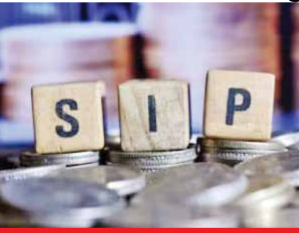
શેર બજારોમાં છેલ્લા કેટલાક મહિનાઓથી થઈ રહેલા ધોવાણના પરિણામે રોકાણકારોનો વિશ્વાસ ડગમગવા લાગ્યો

શેર બજારોમાં છેલ્લા કેટલાક મહિનાઓથી થઈ રહેલા ધોવાણના પરિણામે રોકાણકારોનો વિશ્વાસ ડગમગવા લાગ્યો છે. મ્યુચ્યુઅલ ફંડોમાં ઈક્વિટી ફંડોમાં જાન્યુઆરીમાં રોકાણ પ્રવાહ એકંદરે જળવાઈ રહ્યા છતાં ૩.૬ ટકાનો ઘટાડો નોંધાયા સાથે સિસ્ટેમેટિક ઈન્વેસ્ટમેન્ટ પ્લાન (એસઆઈપી) થકી થતાં રોકાણમાં રોકાણકારો સાવચેત બન્યા છે. જાન્યુઆરીમાં એસઆઈપી એકાઉન્ટો બંધ થવાનો આંક, નવા રજીસ્ટર્ડ થયેલા એકાઉન્ટોના આંકથી વધી ગયો છે. જાન્યુઆરીમાં ૫૬ લાખ નવા એસઆઈપી એકાઉન્ટો ખુલ્યા સામે ૬૧ લાખથી વધુ એકાઉન્ટ બંધ કરવામાં આવ્યા છે. આમ નેટ ધોરણે એસઆઈપી એકાઉન્ટમાં સતત છઠ્ઠા મહિને ઘટાડો થયો છે. બંધ થયેલા એકાઉન્ટોની સંખ્યા જે ડિસેમ્બર ૪૪.૯૦ લાખ હતી, એ જાન્યુઆરીમાં ૬૧.૩૩ લાખ થઈ છે. જ્યારે નવા એસઆઈપી રજીસ્ટ્રેશન ડિસેમ્બરમાં ૫૪.૨૭ લાખ એકાઉન્ટ થયા હતા, એ જાન્યુઆરીમાં ૫૬.૧૯ લાખ થયા છે. જ્યારે એસઆઈપી થકી રોકાણ પ્રવાહ જે