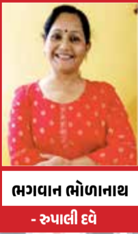
ભગવાન ભોળાનાથ - રૂપાલી દવે

દેવાના બદલે શ્રી રામ નામ સ્મરણ માં વિતાવે છે, એવું કઈક કહું કે શિવજી ને સબક મળે. આમ વિચારી ને માતા સતીએ સીતાજી નું સ્વરૂપ ધારણ કર્યું. .સીતાજી નું સ્વરૂપ ધારણ કરી ને માતા સતીએ ધરતી પર પધાર્યાં. વન વનમાં સીતાજી ને શોધતા પ્રભુ શ્રી રામચંદ્રજી ની સામે એ ધીમે ધીમે ચાલતા ચાલતા આત્યા ને નજીક પ્રણામ કરતા પૂછ્યું કે માતા, આપ એકલા કેમ વિકરાળ વન માં ફરો છો? પત્નીની સીતા ની શોધ માં ભટકી રહ્યો છું, શું આપના નજરે ક્યાંય મારી પત્ની સીતાજી વન નિહાળી છે. પ્રભુ શ્રી રામચંદ્રજી ની વાત સાંભળતા જ માતા સતી ને