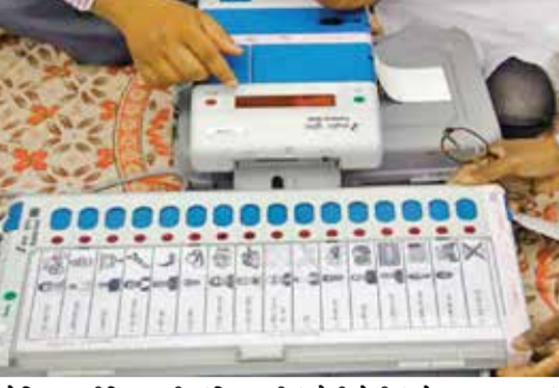
સોશિયલ મીડિયા થકી અંતિમ ઘડીનું એડીયોટીનું જોર લગાવવામાં આવશે.

ભાવનગર અને બોટાદ જિલ્લામાં સ્થાનિક સ્વરાજ્યની ચૂંટણી હવે અંતિમ તબક્કામાં પ્રવેશી ચૂકી છે. પ્રચાર પડઘમ શાંત પડતા ઉમેદવારો પાસે મતદારોને રીઝવવા ગણતરીના કલાકો જ બાકી રહ્યા હોવાથી આવતીકાલે તેઓ માટે કતલની રાત બની રહેશે. તો બીજી તરફ ચૂંટણી તંત્ર પણ તૈયારીઓને આખરી ઓપ આપવામાં વ્યસ્ત થઈ ચૂક્યું છે. શનિવારે સવારે ચૂંટણી કામગીરીના ઓર્ડર મળ્યા બાદ કર્મચારીઓ ઈવીએમ લઈ તેમના મતદાન બૂથે જવા રવાના થશે.