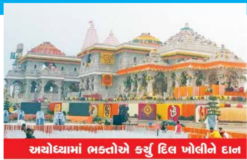
અયોધ્યામાં ભક્તોએ કર્યું દિલ ખોલીને દાન