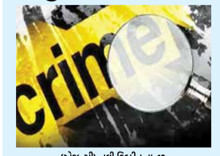
(એજન્સી) નવી દિલ્હી | તા. 19

અભ્યાસ ન કરવા બદલ પિતાએ ઠપકો આપ્યો, ઊંઘમાં જ જીવતા સળગાવી નાખ્યા