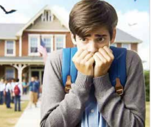
તેની છે. એન્ટી-રેગિંગ સેલ દ્વારા તાત્કાલિક હસ્તક્ષેપ કરવામાં આવ્યો હતો અને કથિત વિદ્યાર્થીઓને કેમ્પસમાંથી સસ્પેન્ડ કરવામાં આવ્યા હતા.

કેરળના તિરુવનંતપુરમમાં કરિયાવદોમ સ્થિત સરકારી કોલેજમાં જુનિયર વિદ્યાર્થી પર રેગિંગ કરતાં સાત વિદ્યાર્થીઓને સસ્પેન્ડ કરવામાં આવ્યા છે. પીડિત વિદ્યાર્થીનું રેગિંગ કરી તેને ઢોરમાર મારવામાં આવ્યો હોવાનું જણાવ્યું છે. પોલીસે પીડિત વિદ્યાર્થીનું નિવેદન લઈ એફઆઈઆર નોંધી છે. રેગિંગનો ભોગ બનેલા વિદ્યાર્થીના પિતાએ જણાવ્યા અનુસાર, પીડિત વિદ્યાર્થીને રેગિંગના કારણે ગંભીર ઈજાઓ થઈ છે અને તેની સારવાર ચાલી રહી છે. મિત્રો વચ્ચે ઝઘડો થયા બાદ તેનું રેગિંગ કરી તેના ઉપર ગંભીર રીતે હુમલો કરવામાં આવ્યો હતો.