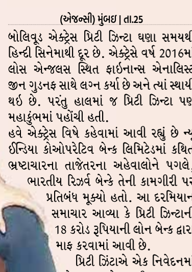
(એજન્સી) મુંબઈ | તા.25

બોલિવૂડ એક્ટ્રેસ પ્રિટી ઝિન્તા ઘણા સમયથી હિન્દી સિનેમાથી દૂર છે. એક્ટ્રેસે વર્ષ 2016માં લોસ એન્જલસ સ્થિત ફાઈનાન્સ એનાલિસ્ટ જીન ગુડનફ સાથે લગ્ન કર્યા છે અને ત્યાં સ્થાયી થઈ છે. પરંતુ હાલમાં જ પ્રિટી ઝિન્તા પણ મહાકુંભમાં પહોંચી હતી. હવે એક્ટ્રેસ વિષે કહેવામાં આવી રહ્યું છે ન્યૂ ઈન્ડિયા કોઓપરેટિવ બેન્ક લિમિટેડમાં કથિત ભ્રષ્ટાચારના તાજેતરના અહેવાલોને પગલે, ભારતીય રિઝર્વ બેન્કે તેની કામગીરી પર પ્રતિબંધ મૂક્યો હતો. આ દરમિયાન સમાચાર આવ્યા કે પ્રિટી ઝિન્તાની 18 કરોડ રૂપિયાની લોન બેન્ક દ્વારા માફ કરવામાં આવી છે.