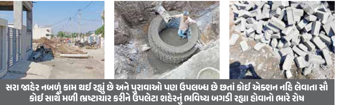
સરા જાહેર નબળું કામ થઈ રહ્યું છે અને પુરાવાઓ પણ ઉપલબ્ધ છે છતાં કોઈ એક્શન નહિ લેવાતા સૌ કોઈ સાથે મળી ભ્રષ્ટાચાર કરીને ઉપલેટા શહેરનું ભવિષ્ય ભગડી રહ્યા હોવાનો ભારે રોષ

તા. ઉપલેટા શહેરમાં હાલ કરોડો રૂપિયાના ભૂગર્ભ ગટરના કામ ચાલી રહ્યા છે જેમાં આ કામની અંદર કામ શરૂ થયું ત્યારથી લઈને આજદિન સુધી નબળી ગુણવત્તા વાળું, હલકું કામ અને નબળા સાધનો અને સંસાધનો વાપરી જેમ તેમ કામ થતું હોવાની અનેક ફરિયાદો ઉપલેટા નગરપાલિકા સમક્ષ સામે આવી હતી જેમાં આ બાબતને લઈને ઉપલેટા શહેરના ઘણા ખરાબ વ્યક્તિઓ દ્વારા લેખિત તેમજ મૌખિક સહિતની અનેકો ફરિયાદો કરવામાં આવી હોવાની માહિતીઓ સામે આવી હતી જેમાં ભૂગર્ભ ગટરના ચાલી રહેલા કામ અંગેની થયેલી ફરિયાદ અને ચાલી રહેલા કામ અંગેની માહિતીઓ માંગવામાં આવતા ઉપલેટા નગરપાલિકા દ્વારા માહિતી પૂરી પાડવામાં આવતી નથી અને આ માહિતી ગુજરાત શહેરી વિકાસ કંપની લિમિટેડ વિભાગને મોકલી દેવાઈ છે ત્યારે આ બાબતે ઉપલેટા નગરપાલિકા કચેરી અને ગુજરાત શહેરી વિકાસ કંપની લિમિટેડ બન્ને માંથી એક પણ વ્યક્તિએ ફરિયાદ અંગેની વિગતો પુરી પડતાં જ નથી અને જાહેર કરતા પણ નથી ત્યારે આ ફરિયાદો બાદ થયેલી કાર્યવાહી અંગેની પણ માહિતીઓ જાહેર ન કરતા હોવાનું સામે