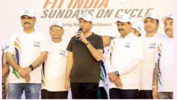
ગાંધીનગર સંગઠાતા વિજયવીર યાદવ

અમદાવાદના સાબરમતી રિવર ફ્રન્ટ પર ઈન્ડિયન મેડિકલ એસોસિયેશન તથા સ્પોર્ટ્સ અથોરિટી ઓફ ઈન્ડિયાના સહયોગથી સન્ડે ઓન સાયકલ યોજાઈ હતી. જેમાં મુખ્ય મહેમાન તરીકે કેન્દ્રીય યુવા બાબતો અને રમતગમત મંત્રી ડૉ. મનસુખ માંડવિયા હાજર રહ્યાં હતાં. રિવરફ્રન્ટ ખાતે 650થી વધુ લોકો સાયકલ ચલાવવા જોડાયા હતા. આ પ્રસંગે કેન્દ્રીય મંત્રી ડૉ. મનસુખ માંડવિયાએ જણાવ્યું કે ફિટ ઈન્ડિયા મુવમેન્ટ સમગ્ર દેશમાં આગળ વધી રહી છે. સન્ડે ઓન સાયકલ ધીમે ધીમે કલ્ચર બનાવવા લાગ્યું છે, આજે 5000થી વધુ સ્થળોએ રોકેટરો સન્ડે ઓન સાયકલિંગ કરીને, ફિટ ઈન્ડિયાનો સંદેશ આપી રહ્યાં છે. આ રવિવારની થીમ IMA દ્વારા દેશભરમાં શરૂ કરવામાં આવી છે. મંત્રીએ વધુમાં જણાવ્યું કે, આપણે ફિટ રહેવું હોય તો સાયકલિંગ કરવું પડશે. આપણે પ્રકૃતિ, પર્યાવરણને બચાવવો હોય, પ્રદૂષણ ઘટાડવા, ટ્રાફિક ઓછો કરવા આપણે સાયકલ ચલાવવી પડશે.