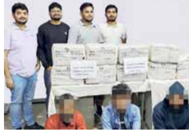
અને ગુવાહાટી ઝોનમાં ધરપકડ કરવામાં આવી છે.

કેન્દ્રીય ગૃહમંત્રી અને સહકારિતા મંત્રી અમિત શાહે કહ્યું છે કે, ડૂંગા કાર્ટેલ માટે કોઈ દયા નહીં રહે. 88 કરોડની કિંમતના મેથાફેટામાઈન ટેબ્લેટ્સનો જંગી જથ્થો જપ્ત કરવા અને આંતરરાષ્ટ્રીય ડૂંગા કાર્ટેલના 4 સભ્યોની ધરપકડ કરવા બદલ નાર્કોટિક્સ કંટ્રોલ બ્યૂરો (એનસીબી) ને અભિનંદન પાઠવતા કેન્દ્રીય ગૃહ પ્રધાને એક X પોસ્ટમાં જણાવ્યું હતું કે ડૂંગાની હેરફેર એ તપાસ માટે બોટમ-ટુ-ટોપ અને ટોપ-ટુ-બોટમ અભિગમની ઉત્કૃષ્ટ કામગીરીનો પુરાવો છે. કેન્દ્રીય ગૃહમંત્રી અને સહકારિતા મંત્રી અમિત શાહે જણાવ્યું હતું કે, 'ડૂંગા કાર્ટેલ માટે કોઈ દયા નહીં. ડૂંગા-મુક્ત ભારત બનાવવા માટે મોદી સરકારની કૂચને વેગ આપતા, 88 કરોડ રૂપિયાના મેથાફેટામાઈન ટેબ્લેટ્સનો મોટો જથ્થો જપ્ત કરવામાં આવ્યો છે, અને આંતરરાષ્ટ્રીય ડૂંગા કાર્ટેલના 4 સભ્યોની ઈન્ફાલ