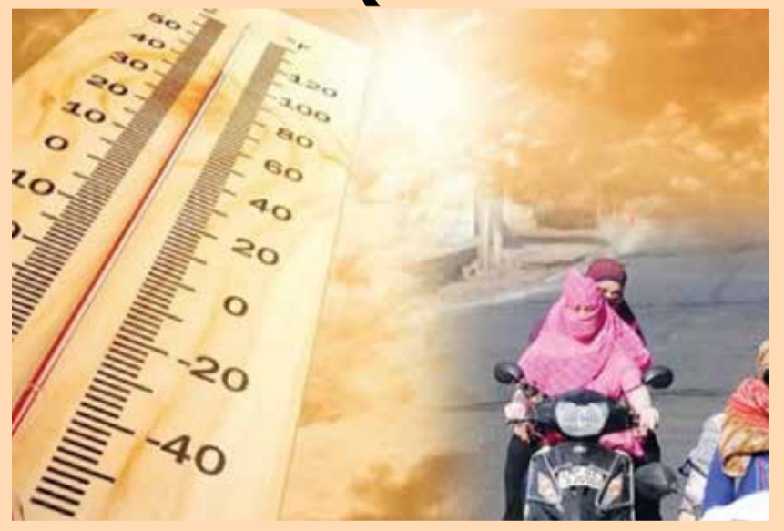
(એજન્સી) અમદાવાદ તા. 16

હવામાન વિભાગની આગાહી મુજબ ગુજરાતમાં આગામી સાત દિવસ વાતાવરણ શુષ્ક રહેવાની સંભાવના છે. આ સાથે જ તાપમાનમાં કોઈ નોંધપાત્ર ફેરફારની શક્યતાઓ નહિવત છે, પરંતુ લઘુત્તમ અને મહત્તમ તાપમાન ઘટતી જતી સ્થિતિમાં રહેશે. પરંતુ આ ઘટાડો ફક્ત એકથી બે ડિગ્રી સેલ્સિયસનો હોઈ શકે છે. આગામી પાંચ દિવસ વાતાવરણ યથાવત રહેવાની શક્યતાઓ છે. ઉલ્લેખનીય છે કે, ગત સપ્તાહની સરખામણીમાં આ સપ્તા દરમિયાન મહત્તમ તાપમાનમાં ઘટાડો આવાતા ગરમીથી ઓશિક રાહત મળી છે. રાજ્યના તમામ જિલ્લાઓનું મહત્તમ તાપમાન 40 ડિગ્રી સેલ્સિયસ કરતા ઓછું નોંધાઈ રહ્યું છે, જેથી