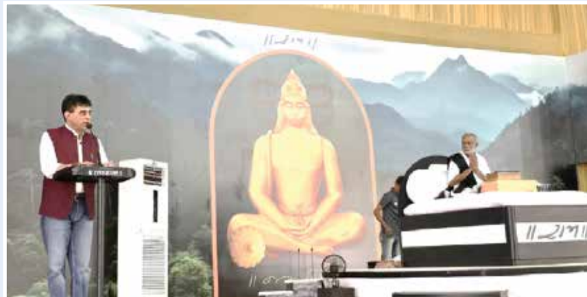
ગાંધીનગર સંવાદદાતા વિજયવીર યાદવ

સોનગઢ ખાતે રાજ્ય શિક્ષણ મંત્રી પ્રફુલભાઈ પાનશેરીયા રામકથાકાર મોરારી બાપુના મુખેથી પવિત્ર રામકથાનું રસપાન કર્યું. મંત્રીએ જણાવ્યું હતું કે, બાપુની મધુર વાણીમાં રામચંદ્રના સદાચાર, ભક્તિ અને ધર્મ પર આધારિત કથાનું શ્રવણ કરવું એ સત્ય, પ્રેમ અને કરુણાની ઉજળી ધારા જેવું છે. રામચરિતમાનસના ઉત્તમ જીવનમૂલ્યો અને આધ્યાત્મિક સંદેશ સાથે જન જનને જોડવાનું ભગીરથ કાર્ય પૂજ્ય મોરારી બાપુ સતત કરતા રહ્યા છે. મંત્રીશ્રીએ જણાવ્યું હતું કે મોરારી બાપુની રામકથા માત્ર ધાર્મિક જ્ઞાન પૂરતું જ નહીં, પરંતુ પ્રેરણાદાયી સંદેશ પણ આપે છે, જે સમાજને નૈતિક મૂલ્યો, સહાનુભૂતિ અને સદ્ભાવના તરફ દોરી જાય છે. પ્રભુ રામના ચરણોમાં શ્રદ્ધા અને સમર્પણ સાથે આ પવિત્ર કથામૃતનો લાભ લેનાર તમામ શ્રોતાઓનું જીવન સુખ-શાંતિ અને મંગલમય બની રહે એવી પ્રાર્થના તેમણે વ્યક્ત કરી.